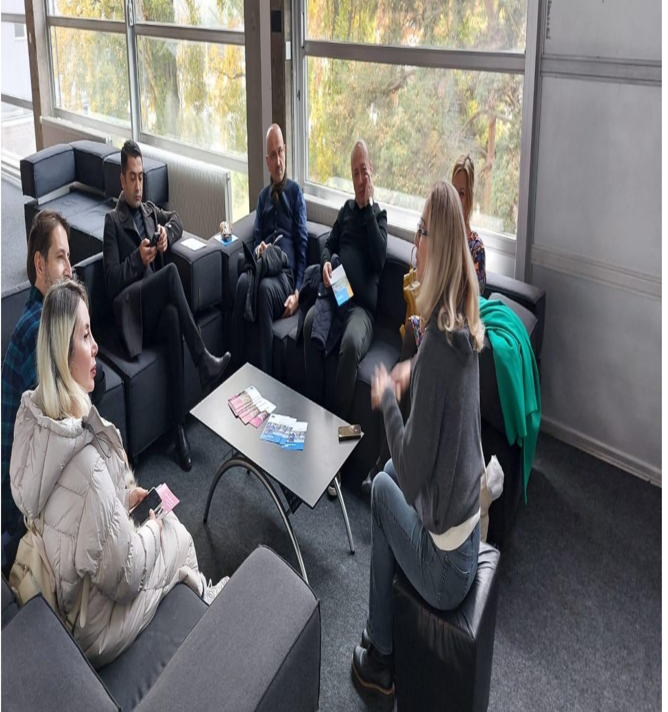
Değerlendirme Toplantısı (Strasbourg/FRANSA)

Son gün yapılan değerlendirme toplantısında ise proje çıktıları ele alınmış, yerel ihtiyaçlara uygun sosyal sorumluluk projeleri geliştirilmesi kararlaştırılmıştır.