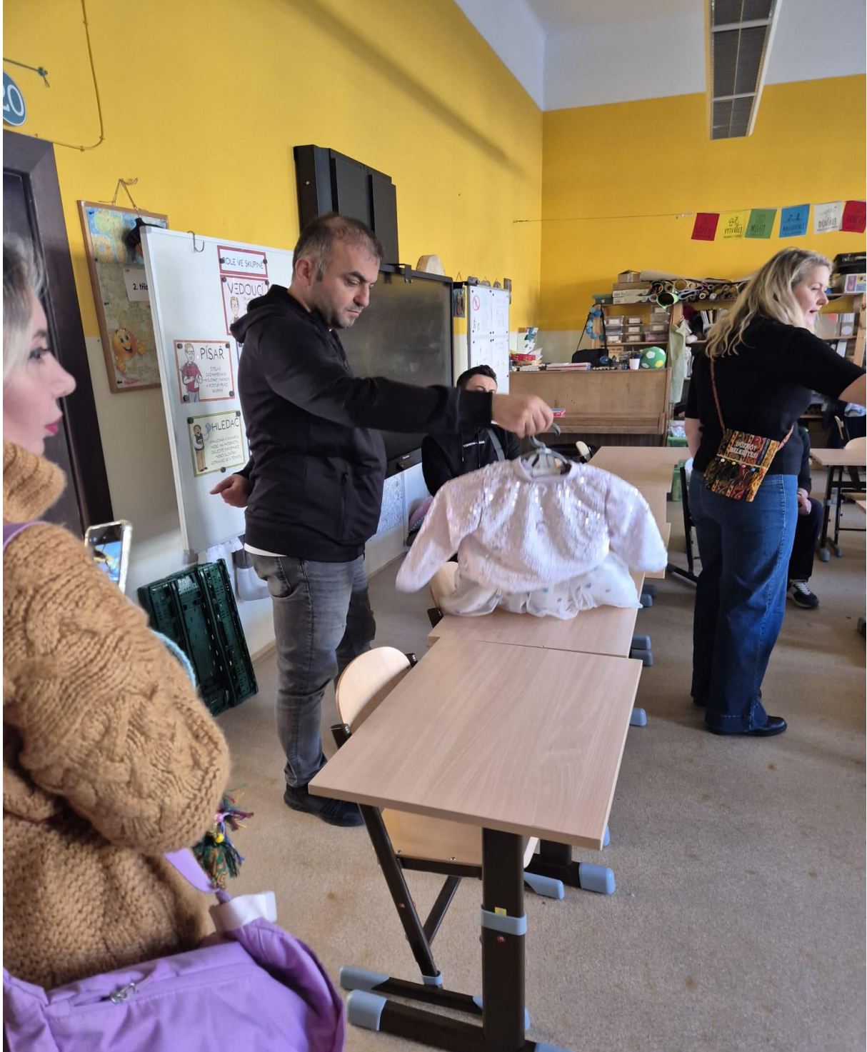
ZS Grafika Okulunun Atölyesi Ziyareti (Prag/ÇEKYA)