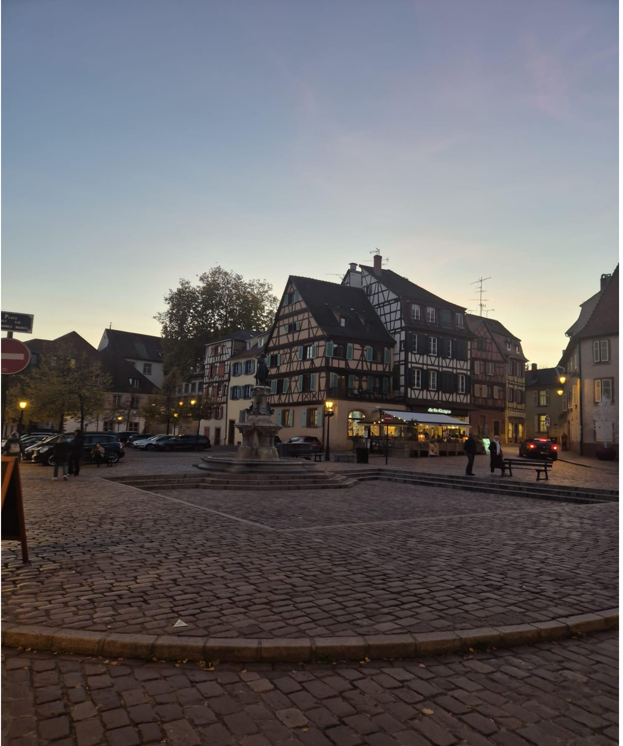
Colmar Bölgesi Mimarisi Tarihi Evler (Strasbourg/FRANSA)