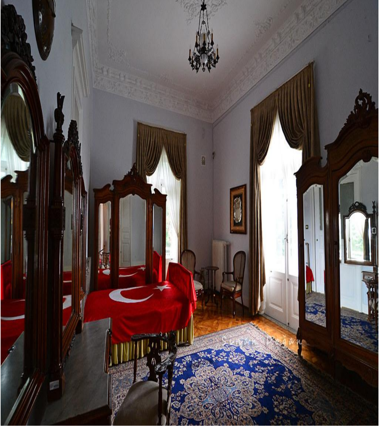
Atatürk'ün Yatak Odası (Atatürk Köşkü-Merkez/Trabzon/TÜRKİYE)