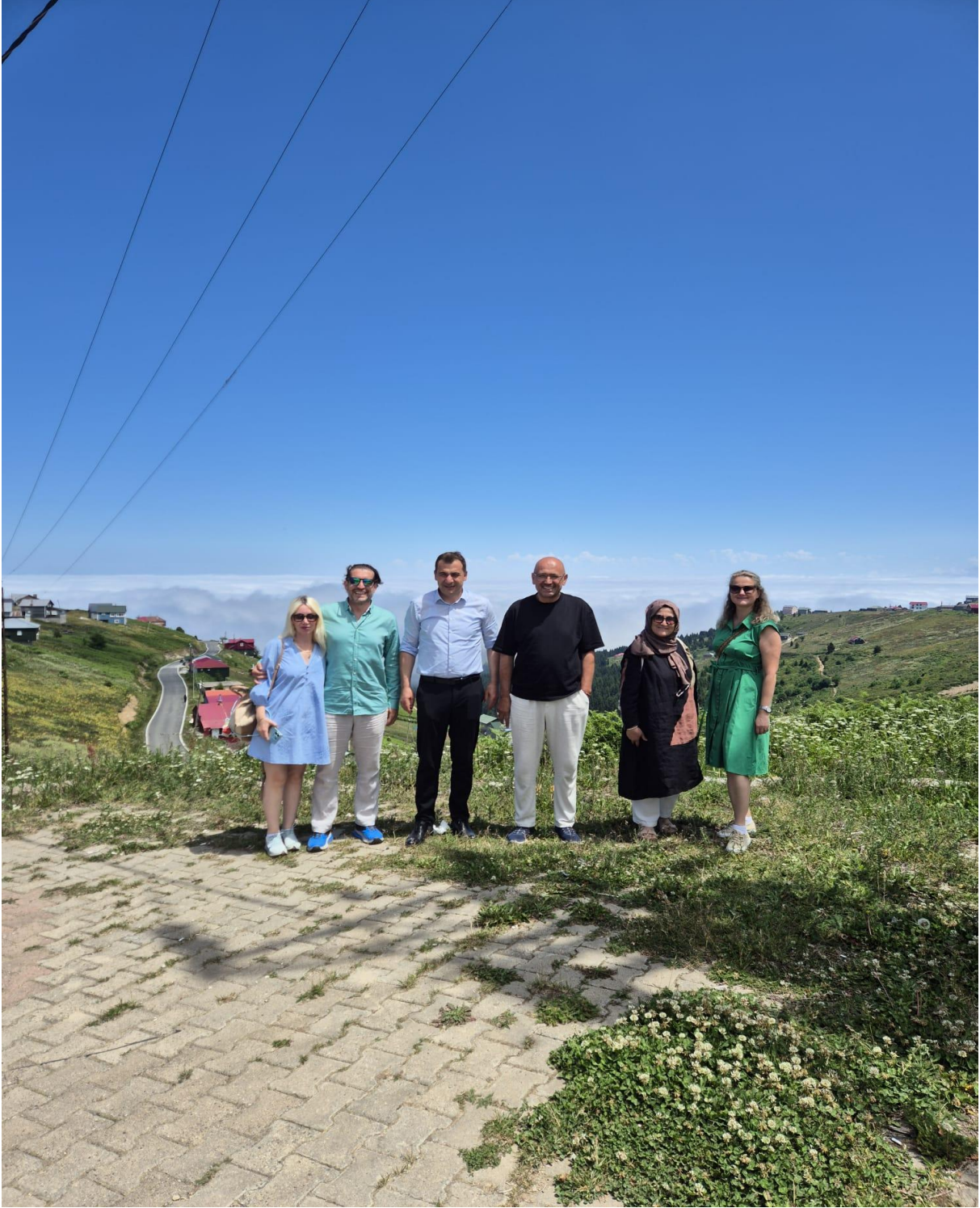
Karadağ Yaylası (İskefiye/Vakfıkebir/Trabzon/TÜRKİYE)