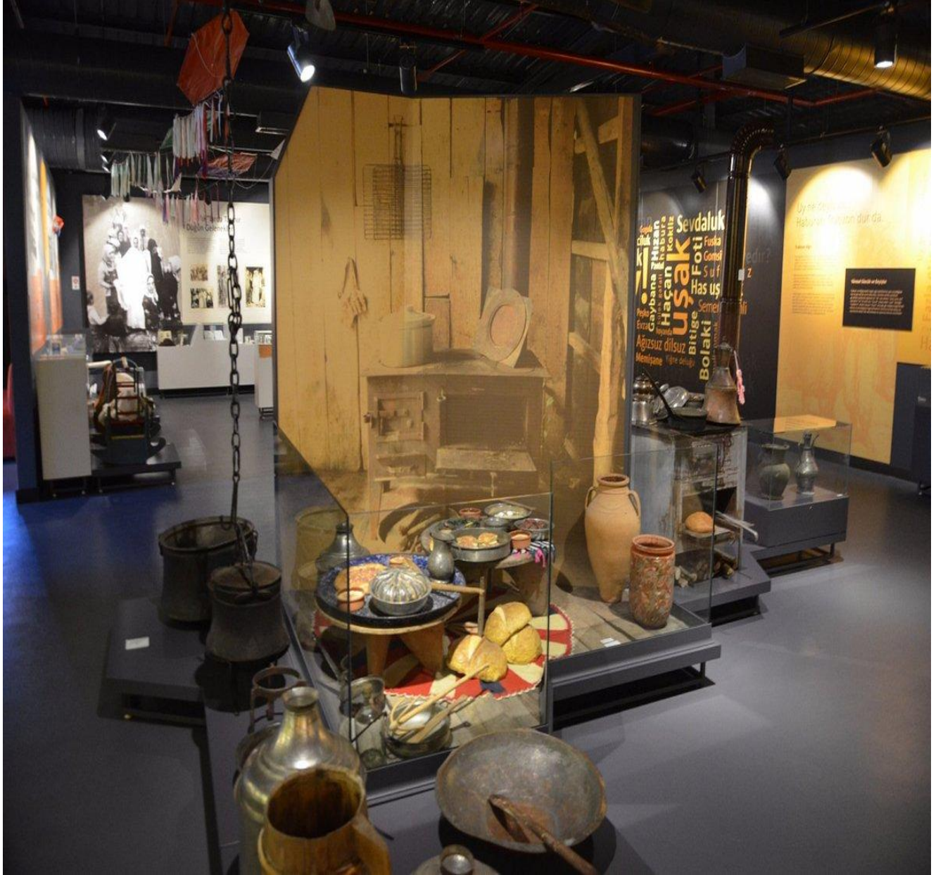
Trabzon Şehir Müzesi (Merkez/Trabzon/TÜRKİYE)