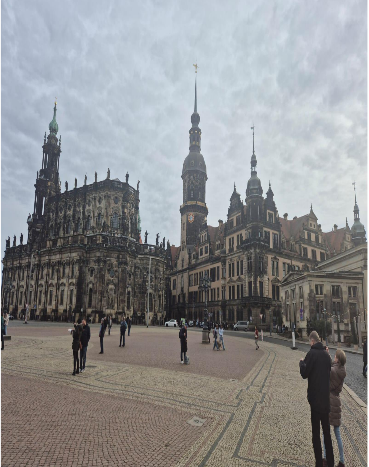
Prag'daki Eski Şehir Meydanı St. Nicholas Kilisesi (Prag/ÇEKYA)