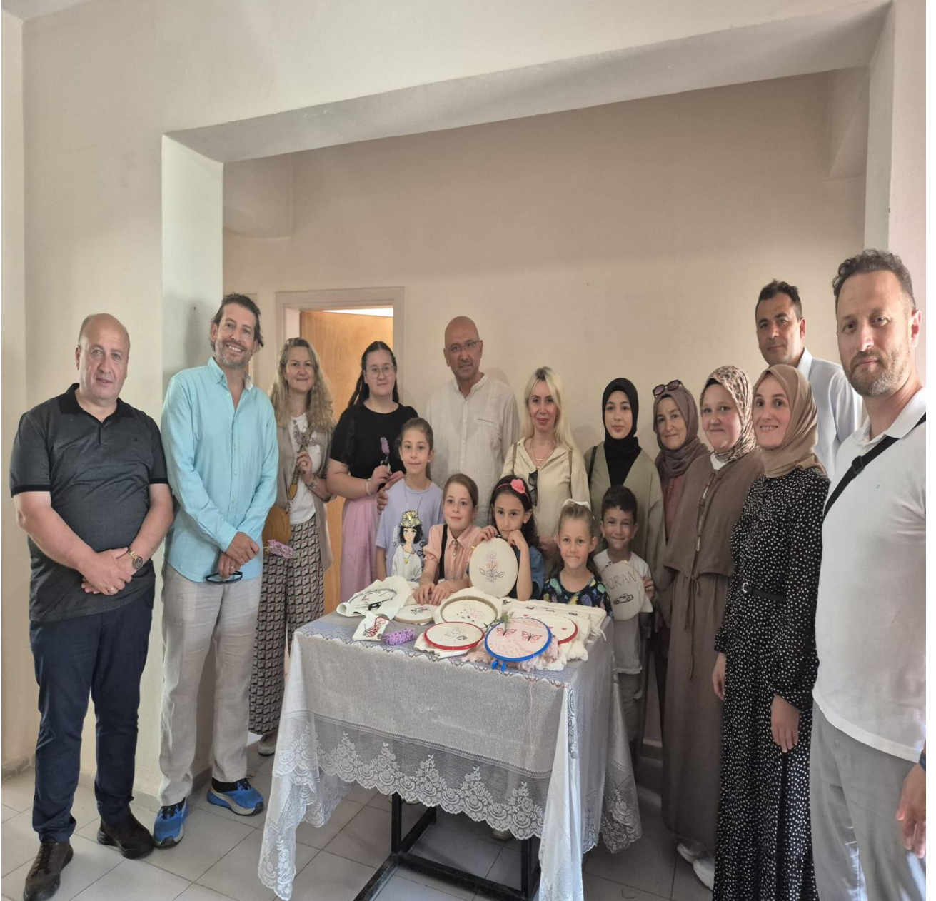
Düzköy Halk Eğitim Merkezi Yöresel Ürünleri(Düzköy/Trabzon/TÜRKİYE)