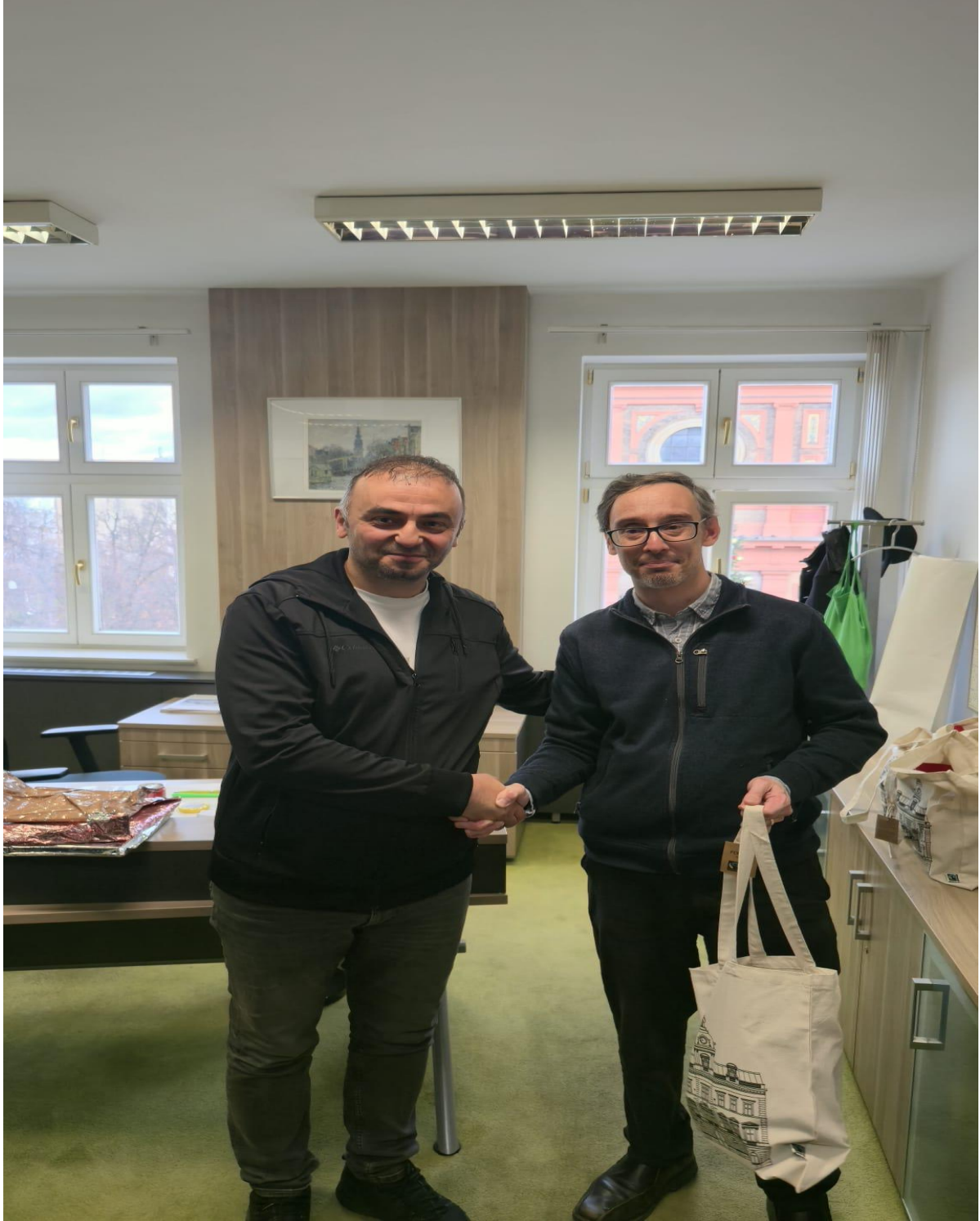
Mestska Cast Praha 5 Belediyesi Başkan Yardımcısı (Prag/ÇEKYA)