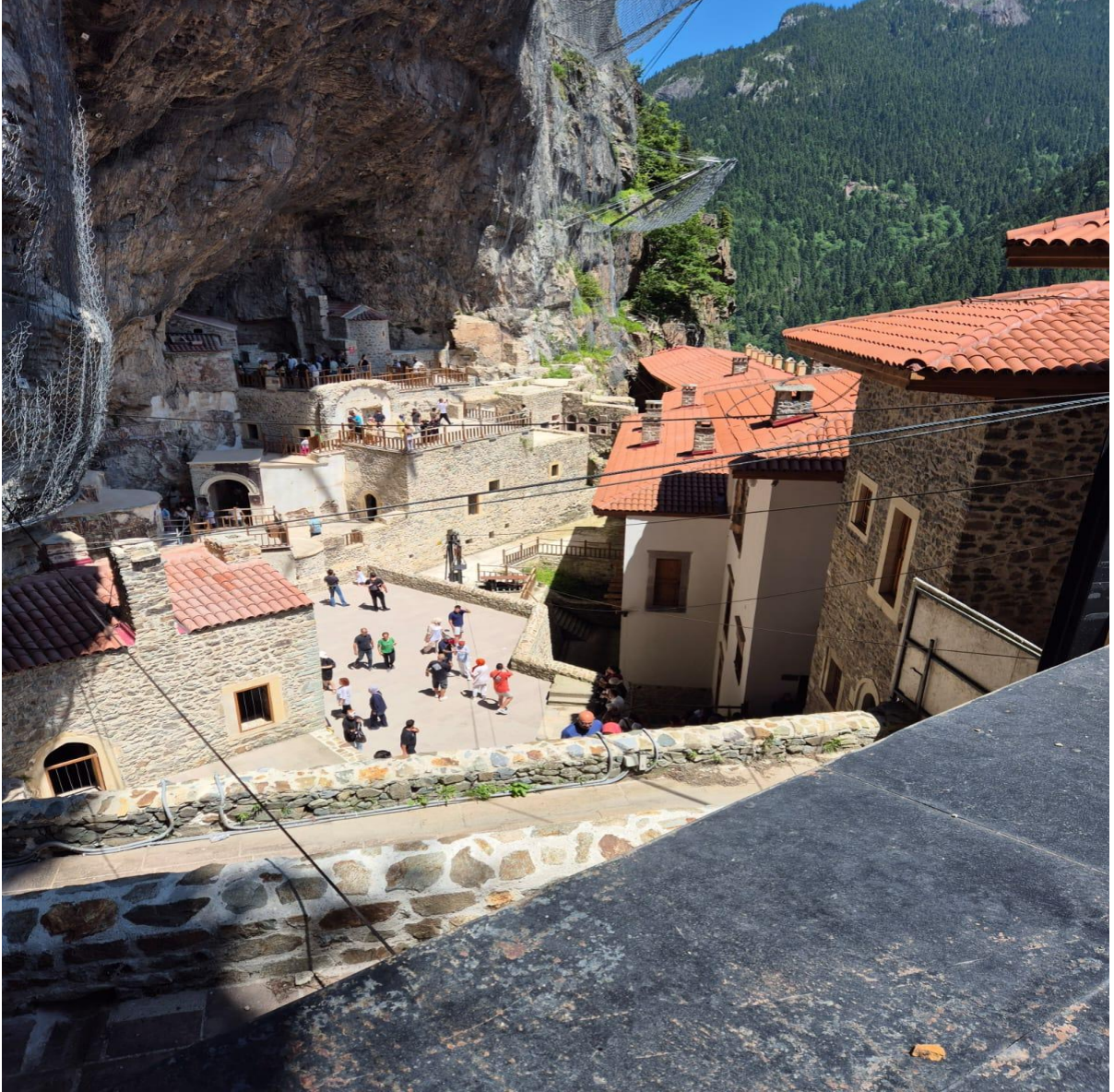
Sümela Manastırı (Maçka/Trabzon/TÜRKİYE)

Program kapsamında Sümela Manastırı, Uzungöl ve Çal Mağarası gibi bölgenin simge yerleri ziyaret edilmiştir. Ayrıca Şoroğma Kayaları, Hirsafa, Karadağ ve Hıdırnebi yaylalarında doğa yürüyüşleri yapılarak katılımcılara benzersiz bir deneyim sunulmuştur.