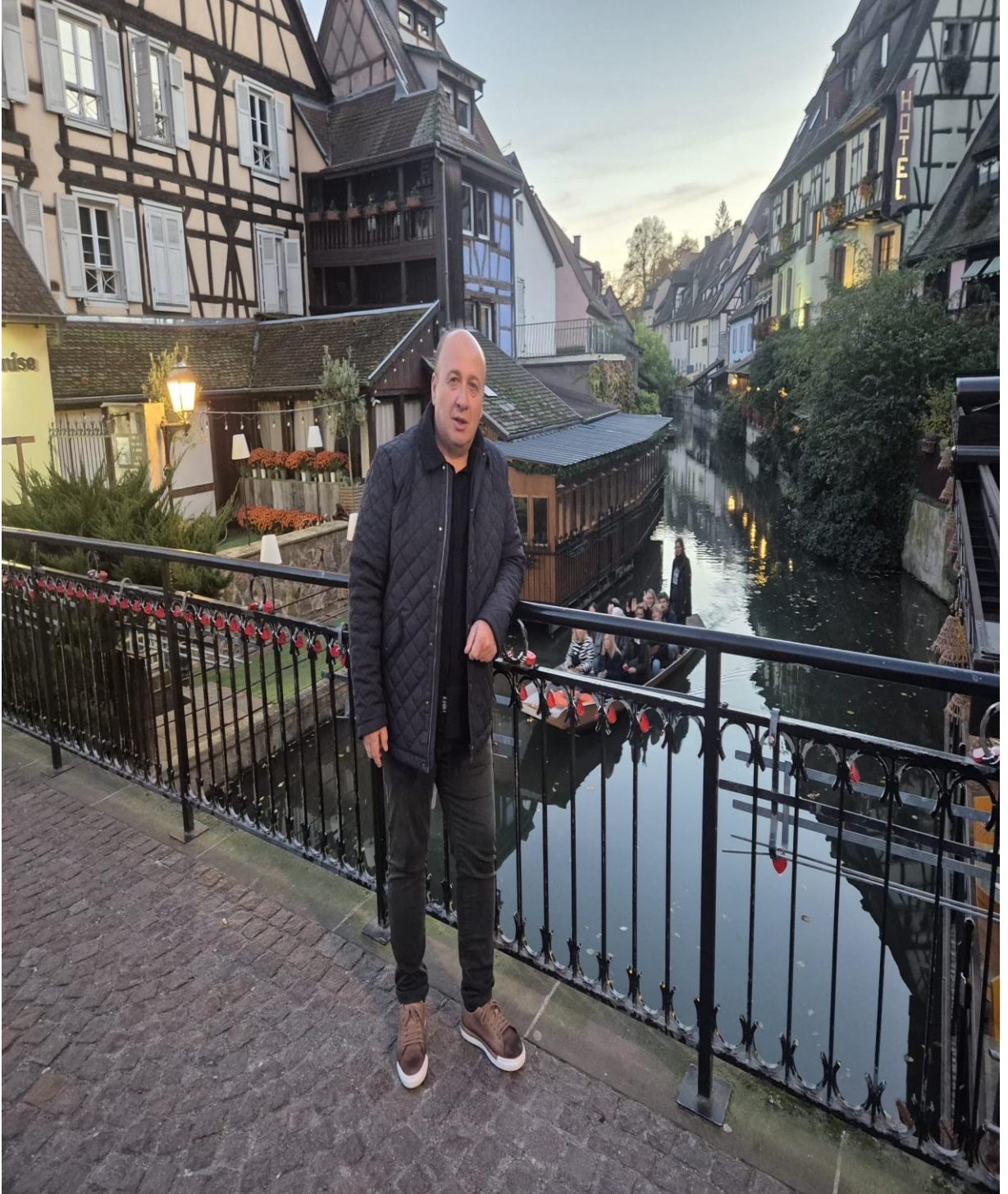
Colmar Bölgesi Küçük Venedik (Strasbourg/FRANSA)