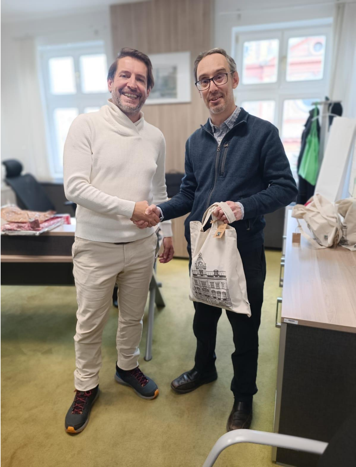
Mestska Cast Praha 5 Belediyesi Başkan Yardımcısı (Prag/ÇEKYA)