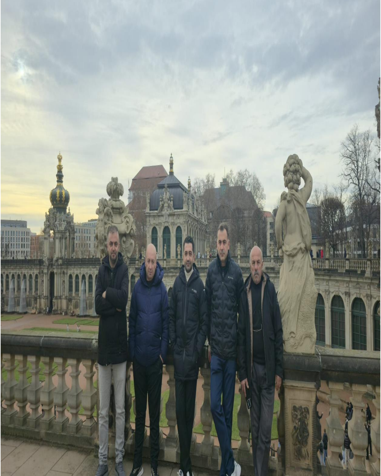
Dresden şehrindeki ünlü Barok yapısı Zwinger Sarayı (Dresden/ALMANYA)