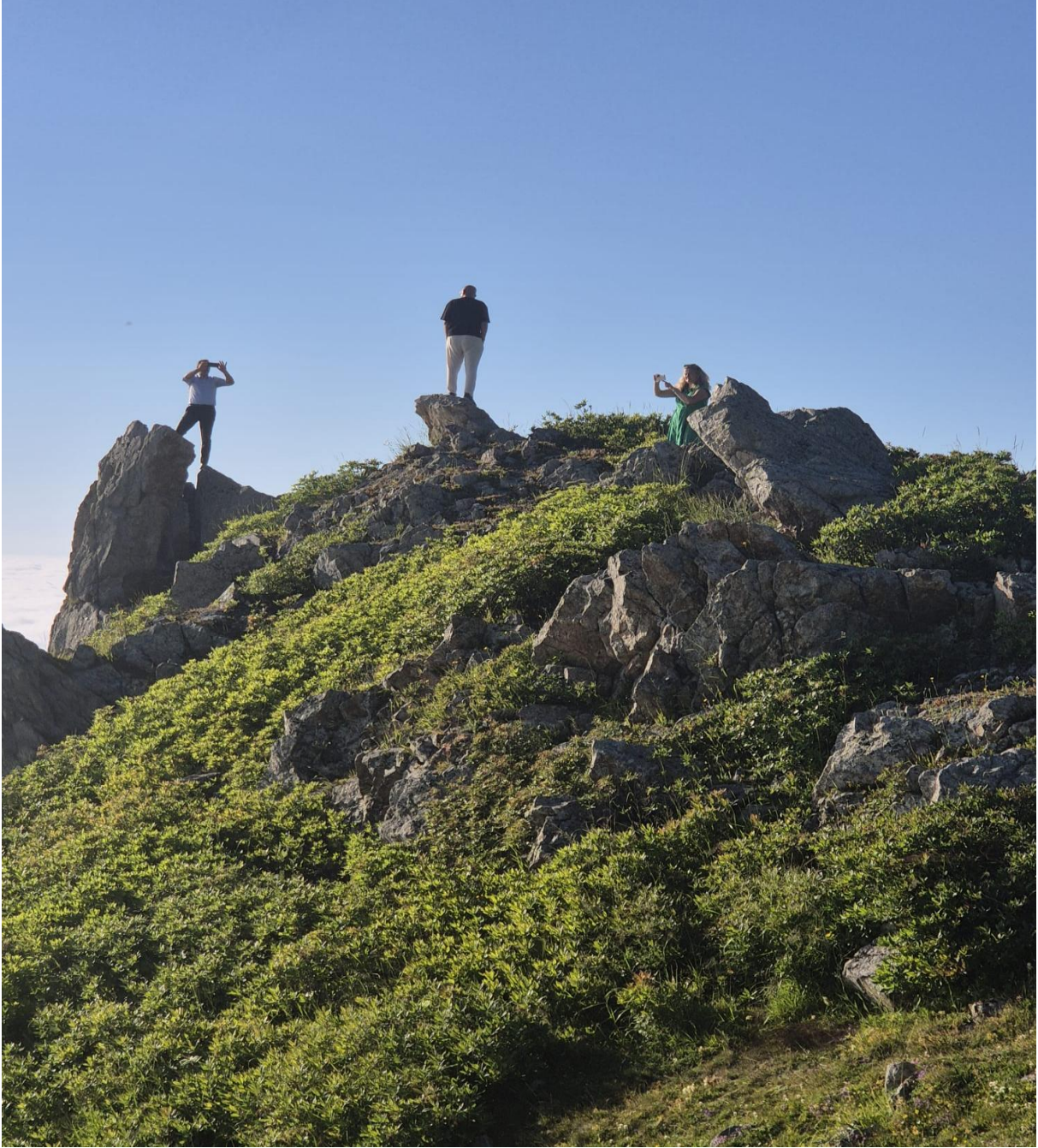
Şoroğma Kayaları (Çayırbağı /Düzköy/Trabzon/TÜRKİYE)