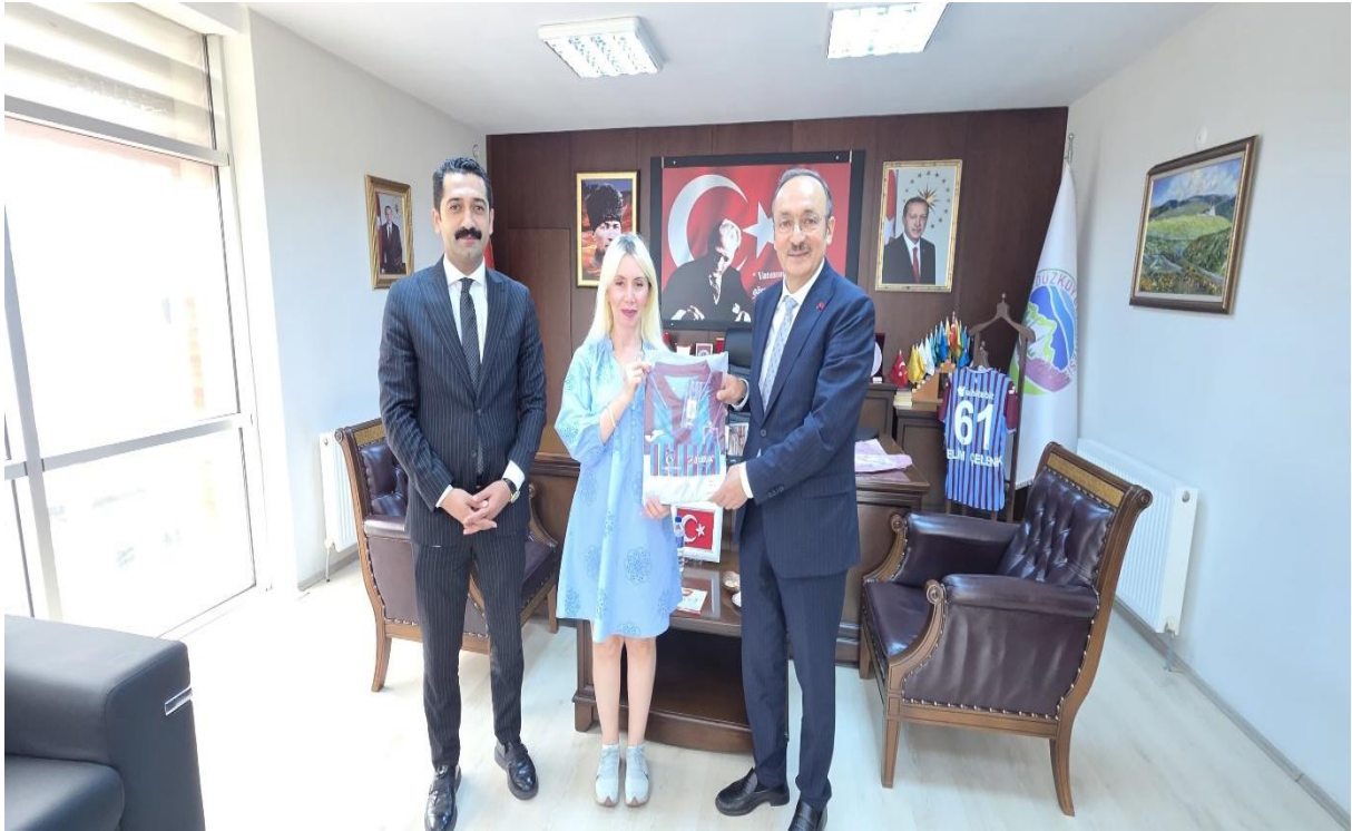
Düzköy Belediye Başkanı Odası (Düzköy/Trabzon/TÜRKİYE)