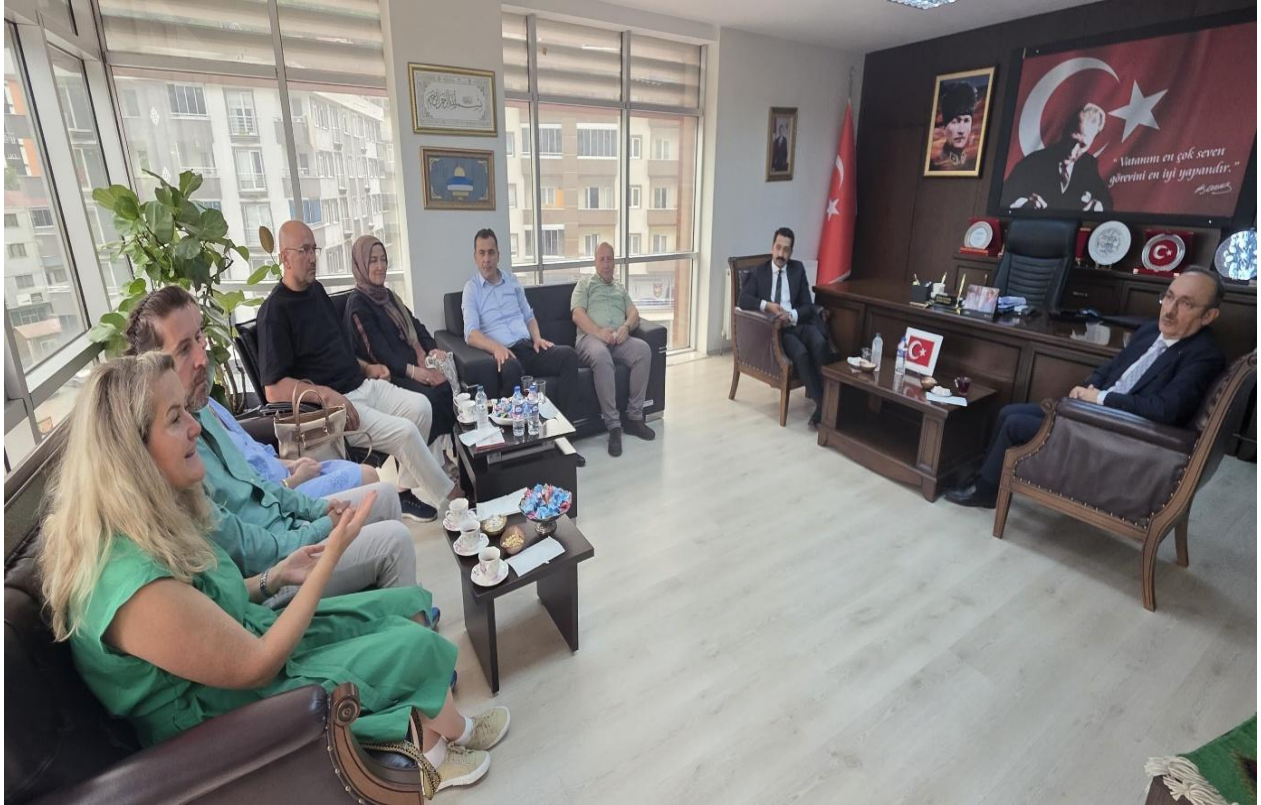
Düzköy Belediye Başkanı Odası (Düzköy/Trabzon/TÜRKİYE)

Projenin son gününde Düzköy Belediye Başkanı'nın odasında kapsamlı bir değerlendirme toplantısı yapılmıştır. Kaymakam ve Belediye Başkanı'nın katılımıyla gerçekleşen toplantıda, dört günlük faaliyetlerin sonuçları ele alınmıştır.