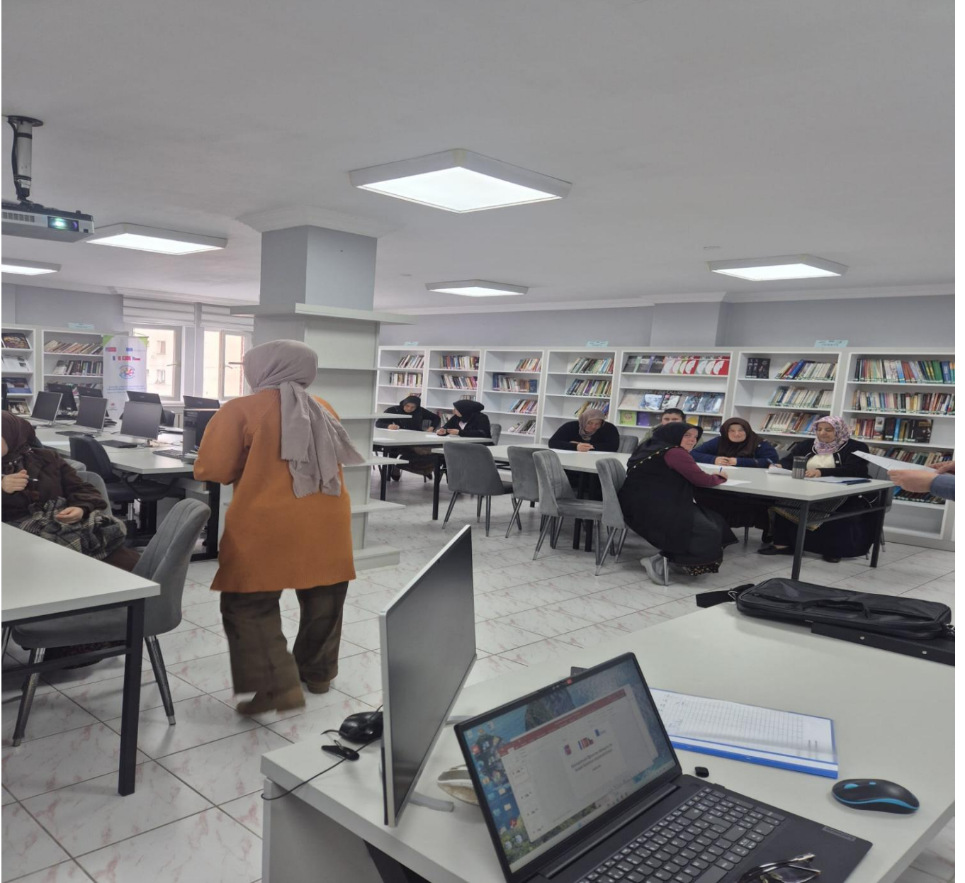
Katılımcı Bireylerin Görselleri (Düzköy/Trabzon/TÜRKİYE)