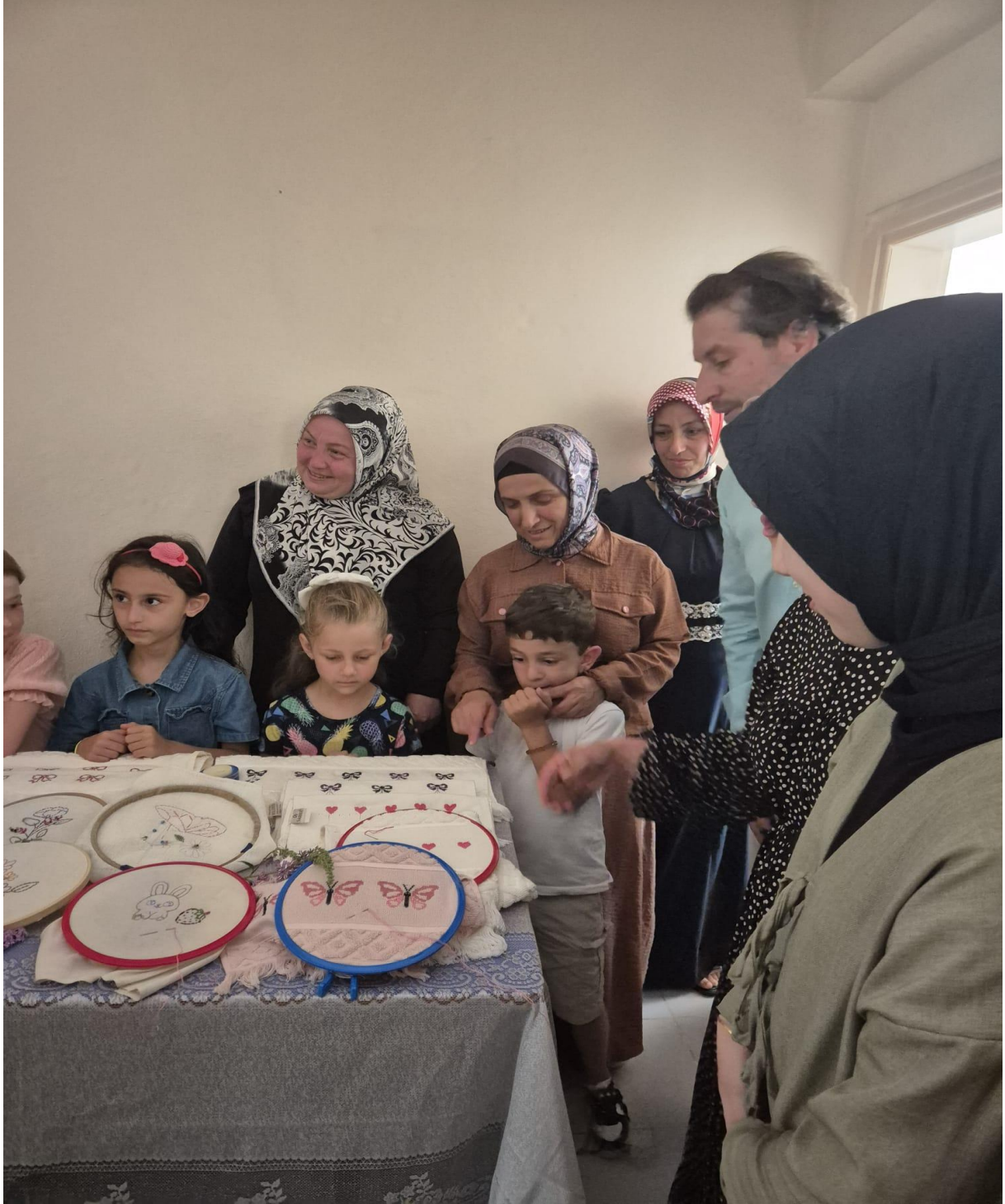
Düzköy Halk Eğitim Merkezi Yöresel Ürünleri(Düzköy/Trabzon/TÜRKİYE)