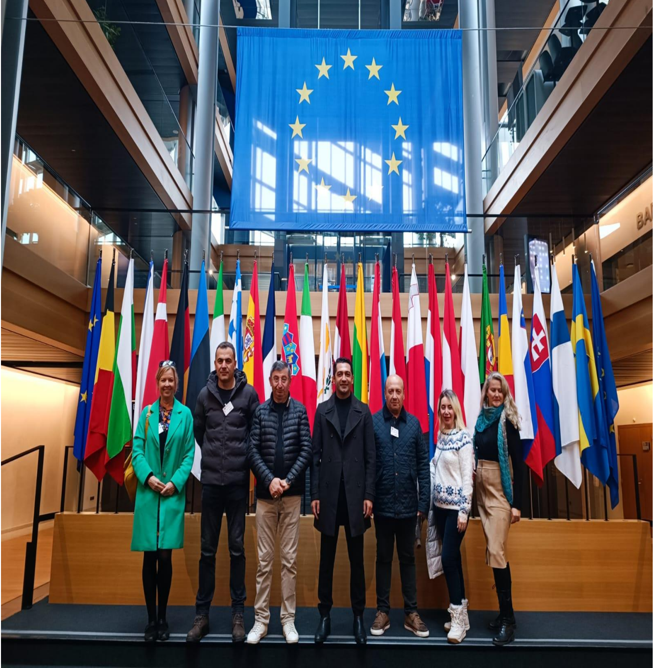
Avrupa Birliğine Bağlı Ülkelerin Bayrakları Önünden Görüntü (Strasbourg/FRANSA)