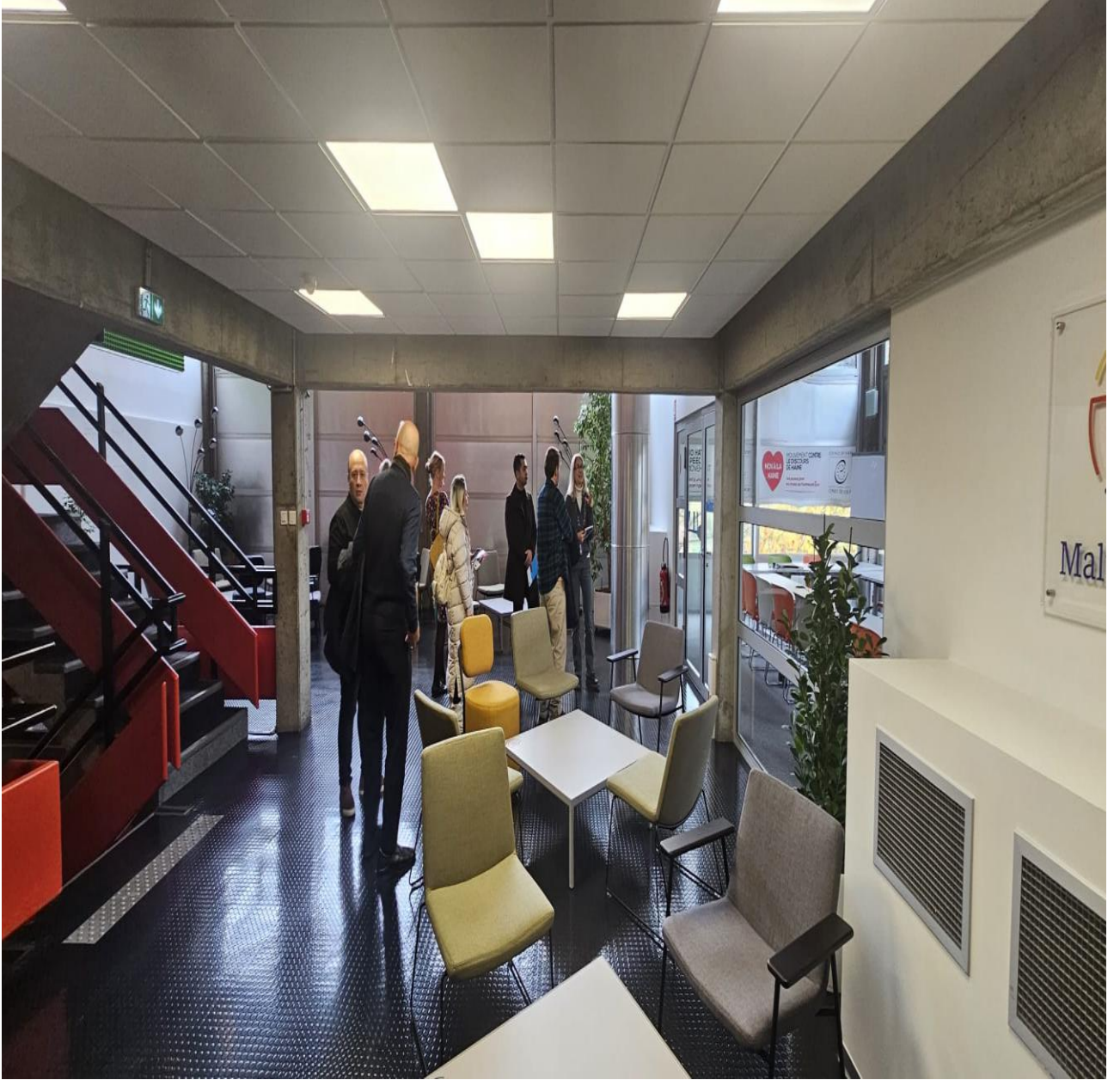
Avrupa Birliđi Binasında Toplantı Öncesi Hazırlık (Strasbourg/FRANSA)