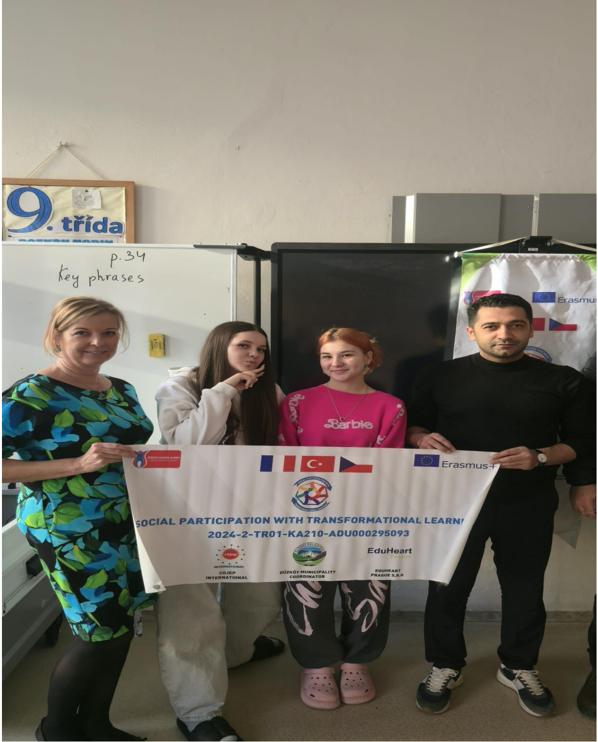
ZS Grafika Okulu Öğrencileri, Müdüre Hanım ve Düzköy Kaymakamı (Prag/ÇEKYA)