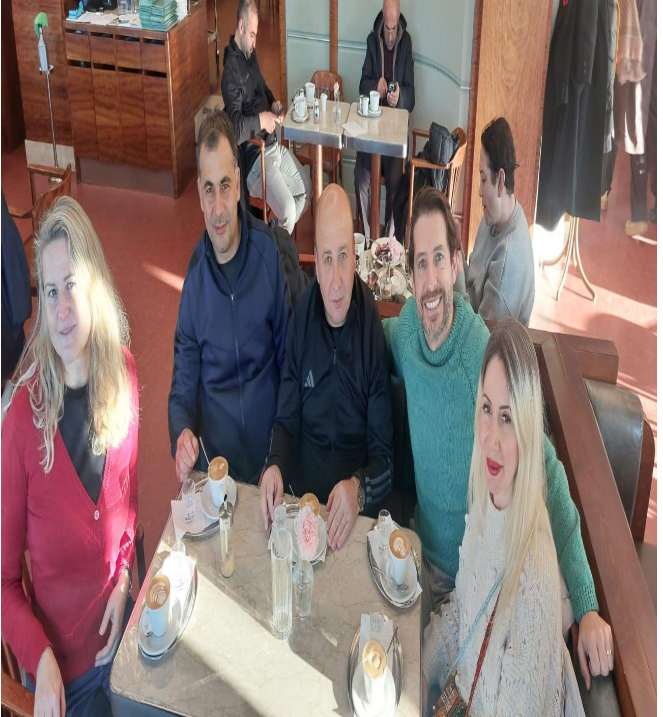
Pragda Café Louvre (Prag/ÇEKYA)