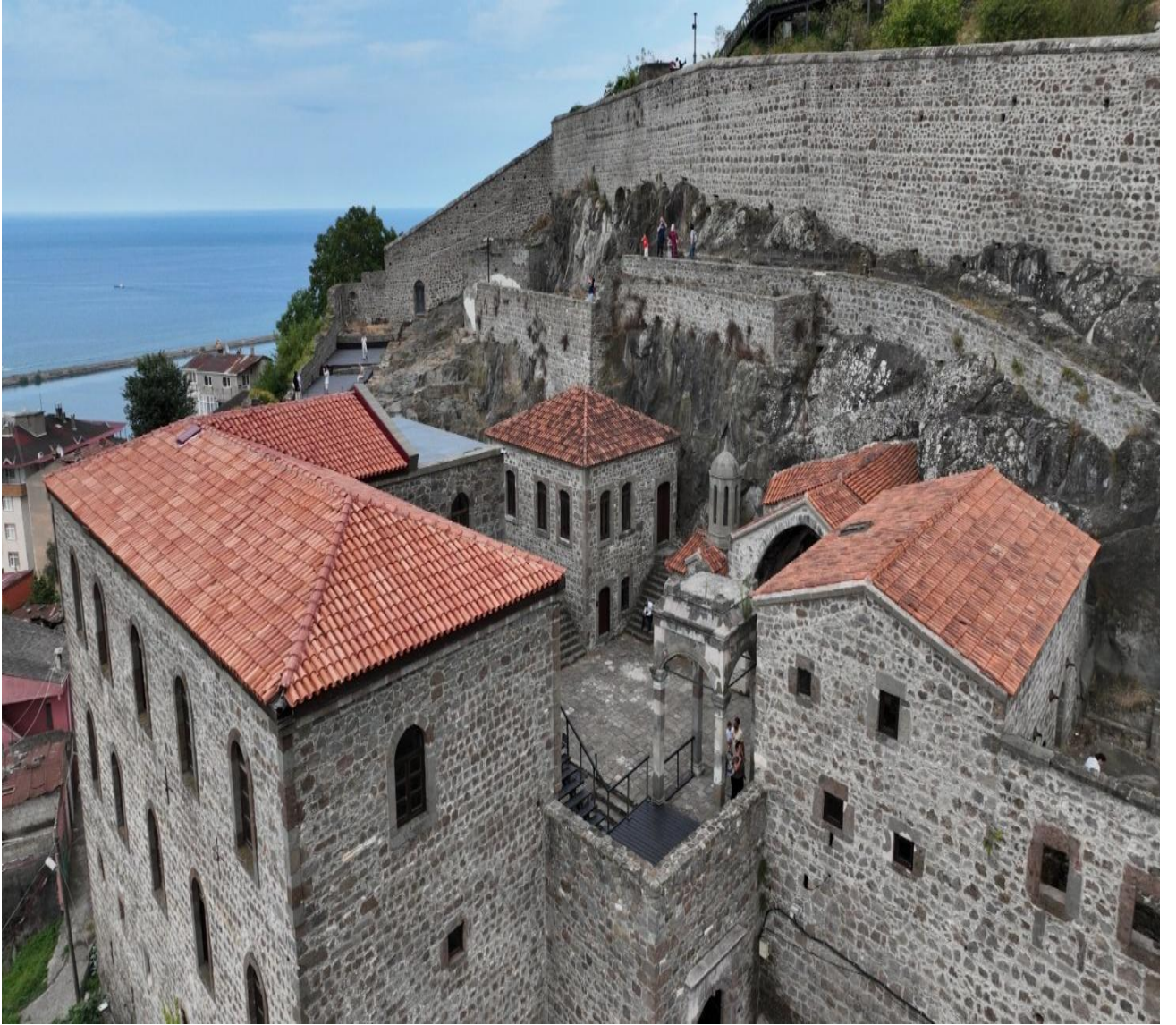
Kızlar Manastırı (Merkez/Trabzon/TÜRKİYE)

Kızlar Manastırı, Trabzon Şehir Müzesi ve Akvaryum ziyaretlerinde katılımcılar gözlem ve deneyim odaklı bir öğrenme süreci yaşamışlardır. Boztepe Seyir Terası'ndan şehir panoraması izlenmiştir