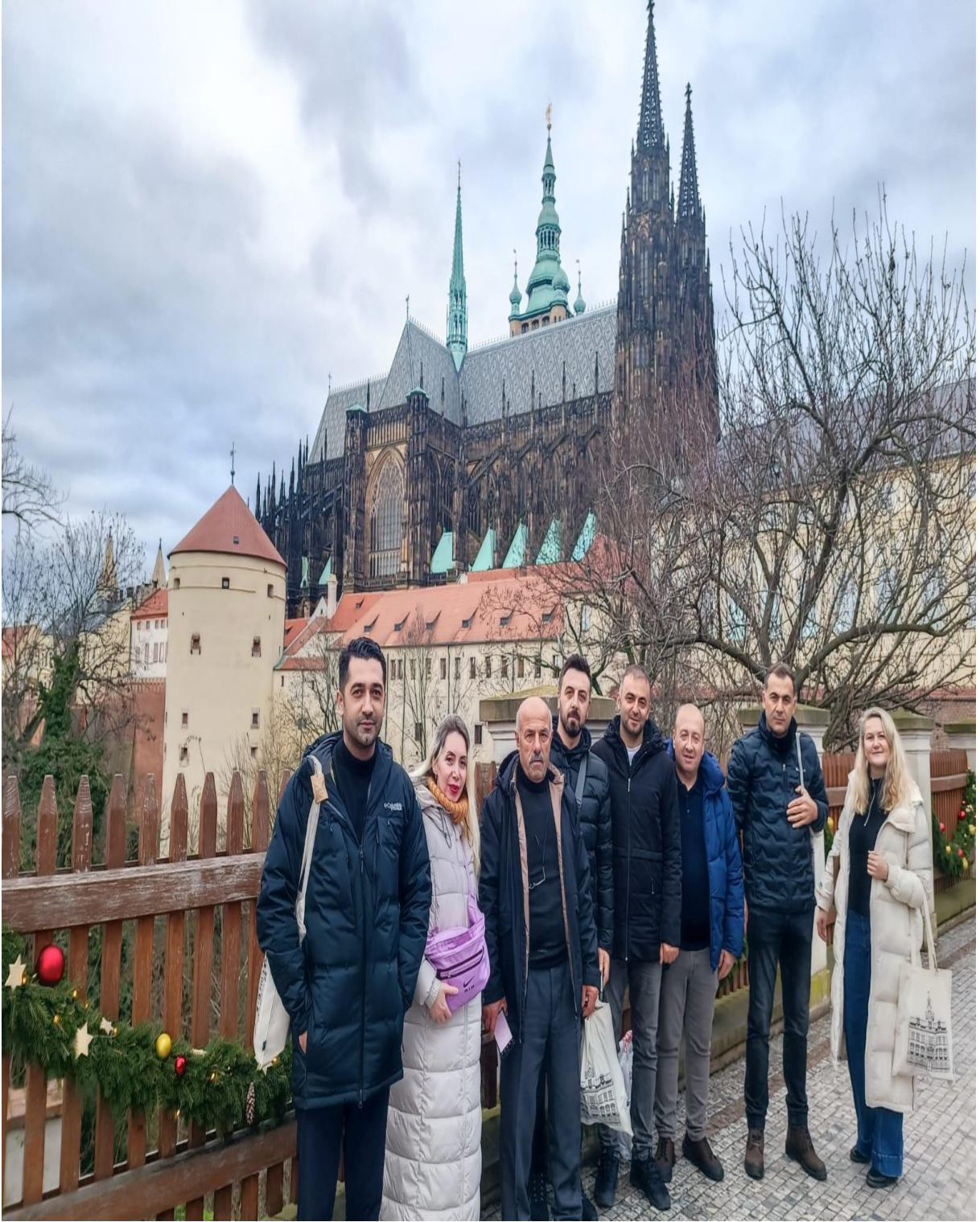
Mestska Cast Praha 5 Belediyesi Sonrası Görseli (Prag/ÇEKYA)