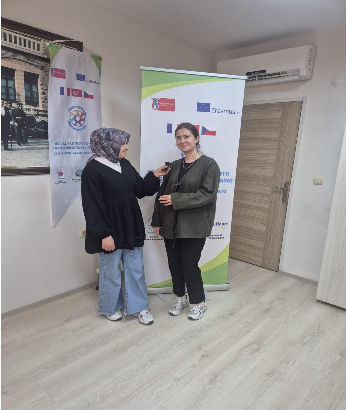
Katılımcılar ile Röportaj Görseli (Düzköy/Trabzon/TÜRKİYE)