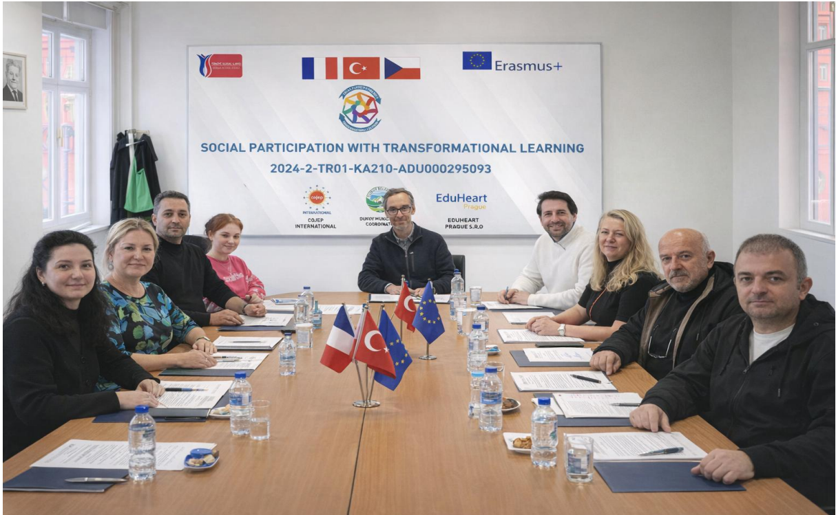
Belediye, EduHeart ve Cojep Ekibi Tarafından ZS Grafika Okulunda Toplantı (Prag/