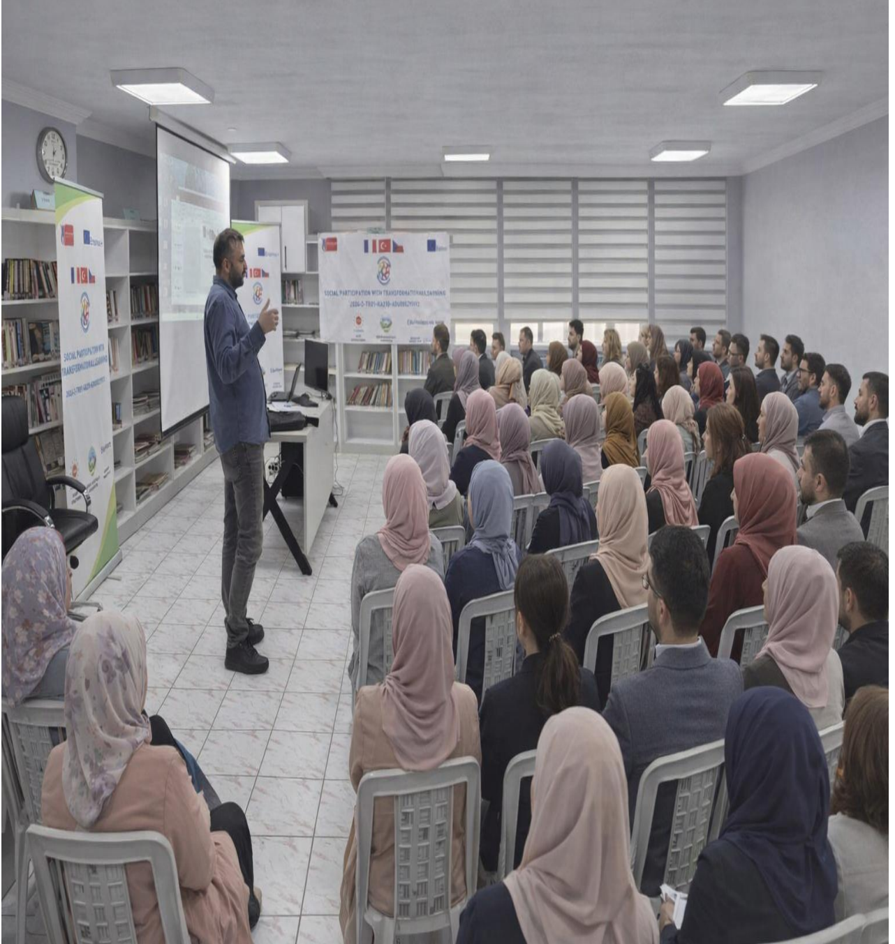
Projenin Sunumu Görseli (Düzköy/Trabzon/TÜRKİYE)