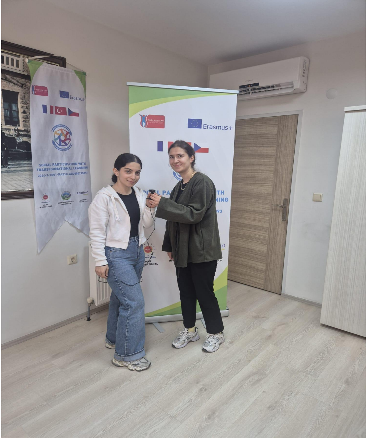
Katılımcılar ile Röportaj Görseli (Düzköy/Trabzon/TÜRKİYE)