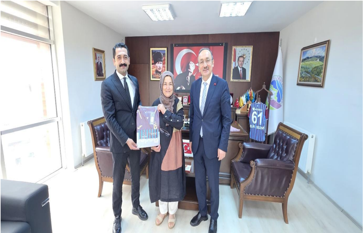
Düzköy Belediye Başkanı Odası (Düzköy/Trabzon/TÜRKİYE)