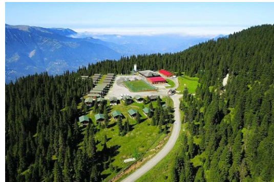
Sosyal Yaşamdan Alanlarından Görseller (Düzköy/Trabzon/TÜRKİYE)