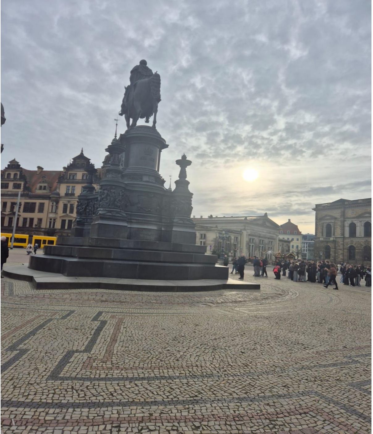
Dresden'deki Theaterplatz Meydanı (Dresden/ALMANYA)