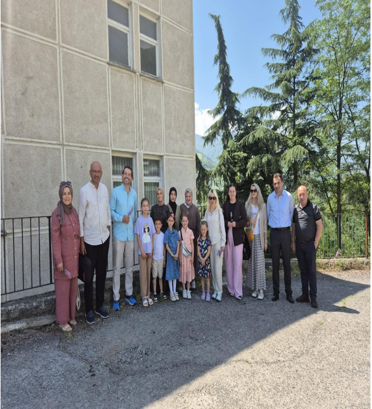
Düzköy Halk Eğitim Merkezi Binası Önü (Düzköy/Trabzon/TÜRKİYE)