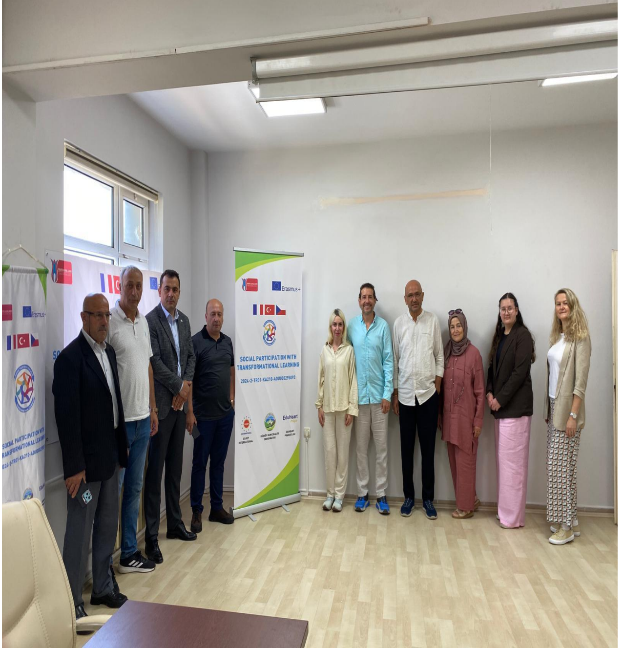
Düzköy Kaymakamlığı Toplantı Salonu (Düzköy/Trabzon/TÜRKİYE)