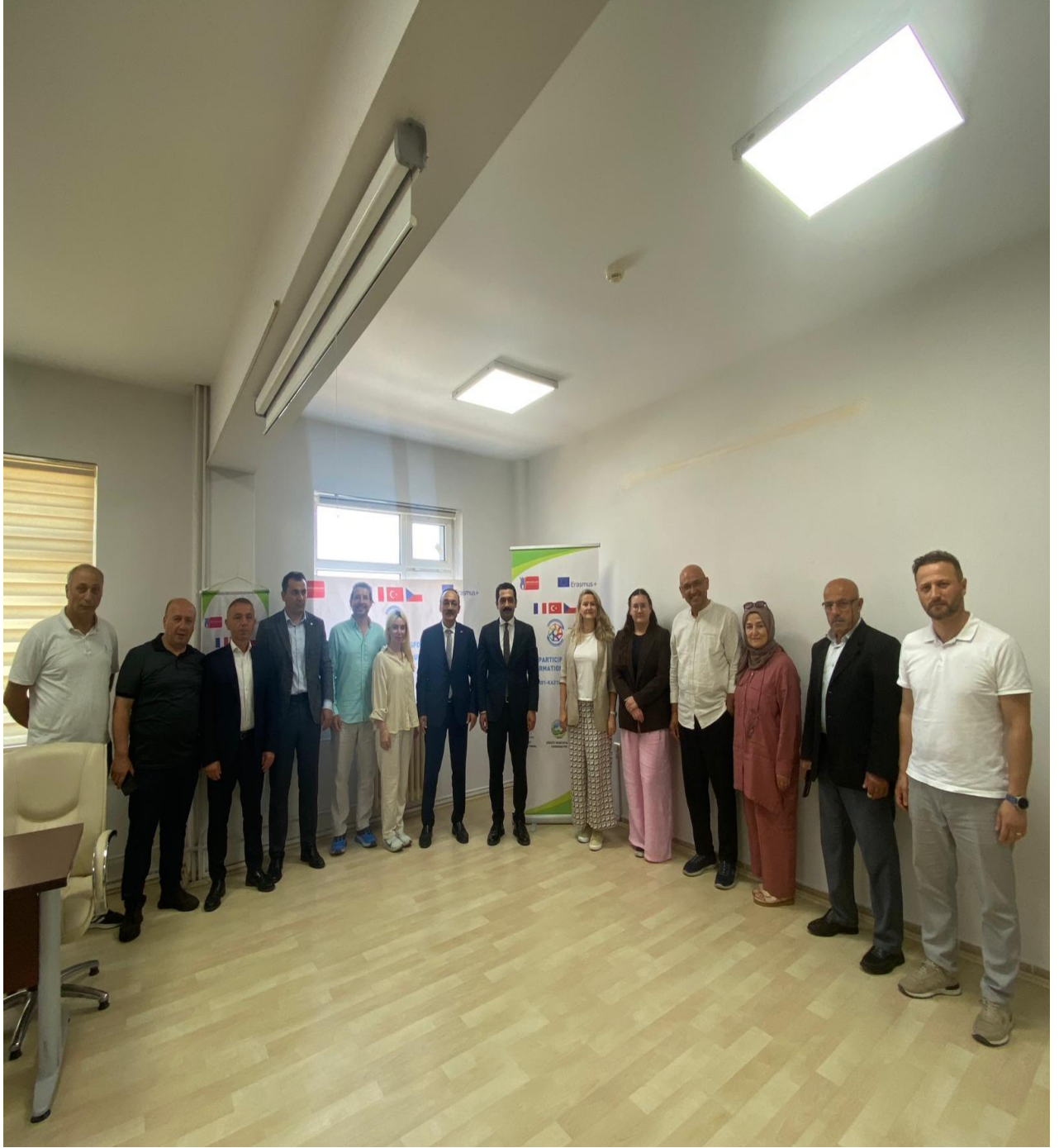
Düzköy Kaymakamlığı Toplantı Salonu (Düzköy/Trabzon/Türkiye)