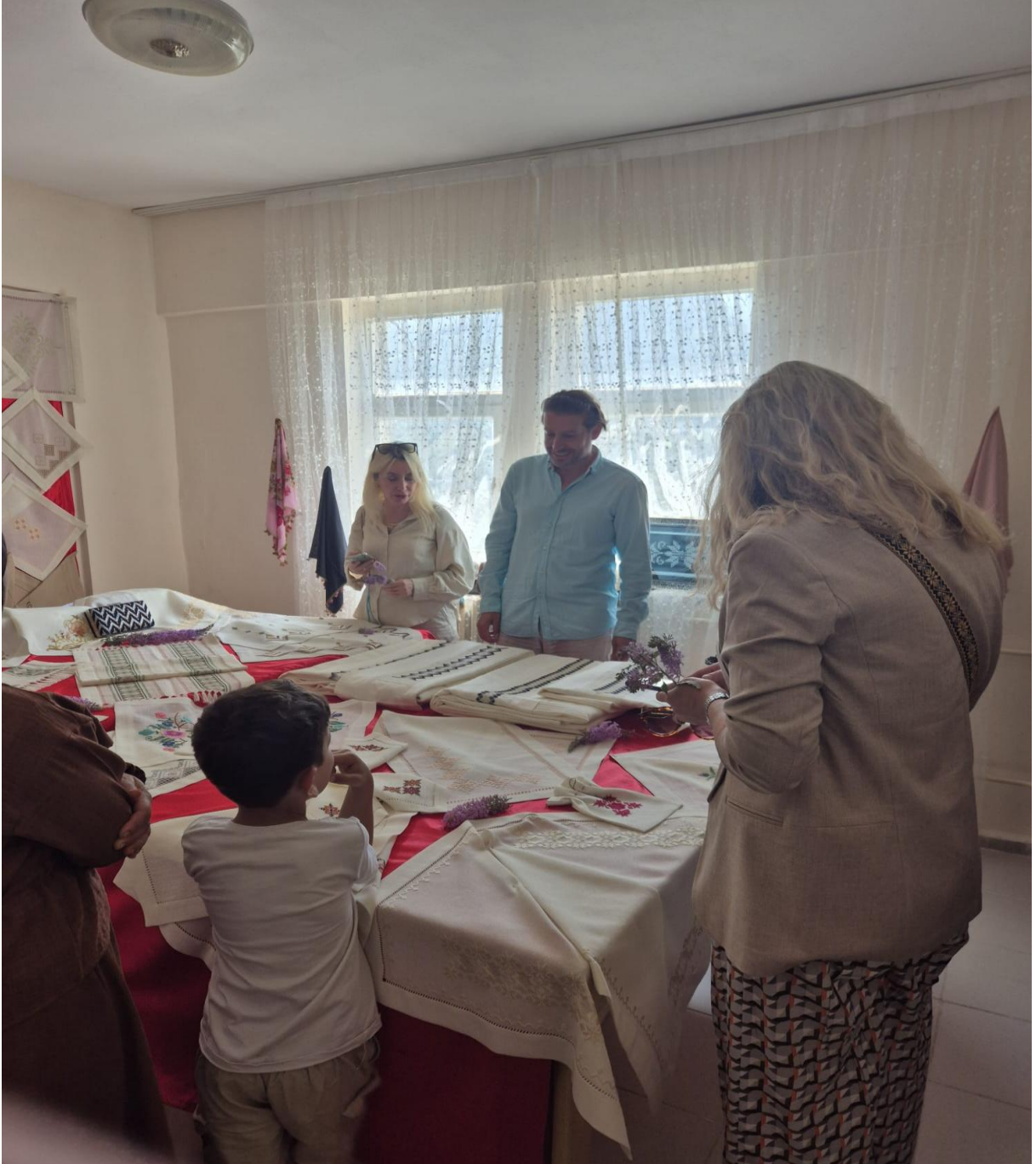
Düzköy Halk Eğitim Merkezi Yöresel Ürünleri (Düzköy/Trabzon/TÜRKİYE)