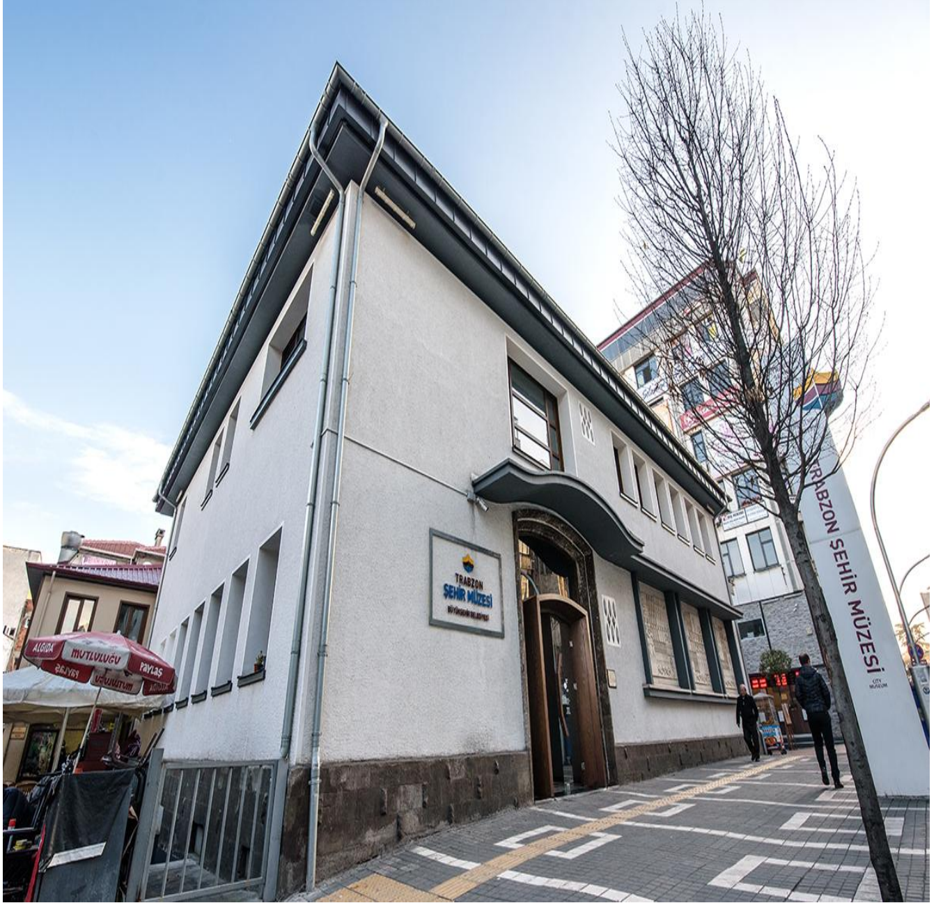
Trabzon Şehir Müzesi (Merkez/Trabzon/TÜRKİYE)