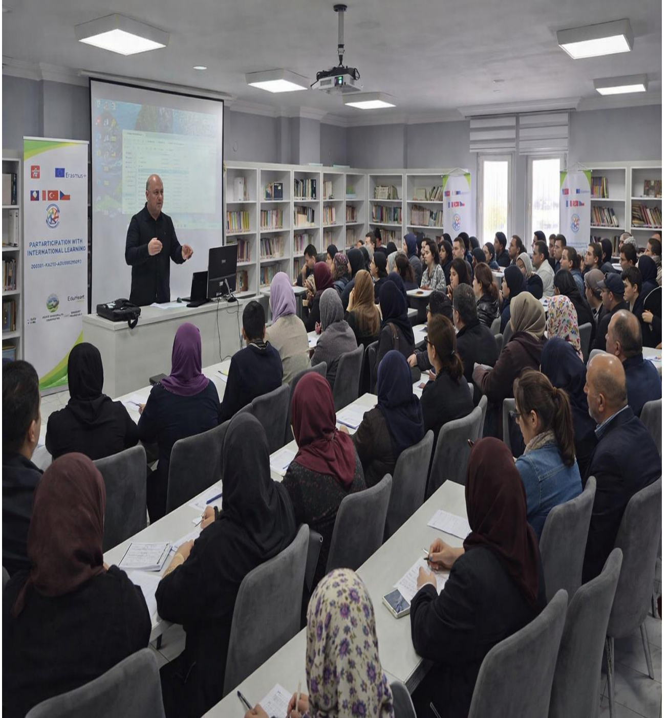
Katılımcıların Ön Test ve Son Test Uygulama Görselleri (Düzköy/Trabzon/TÜRKİYE)