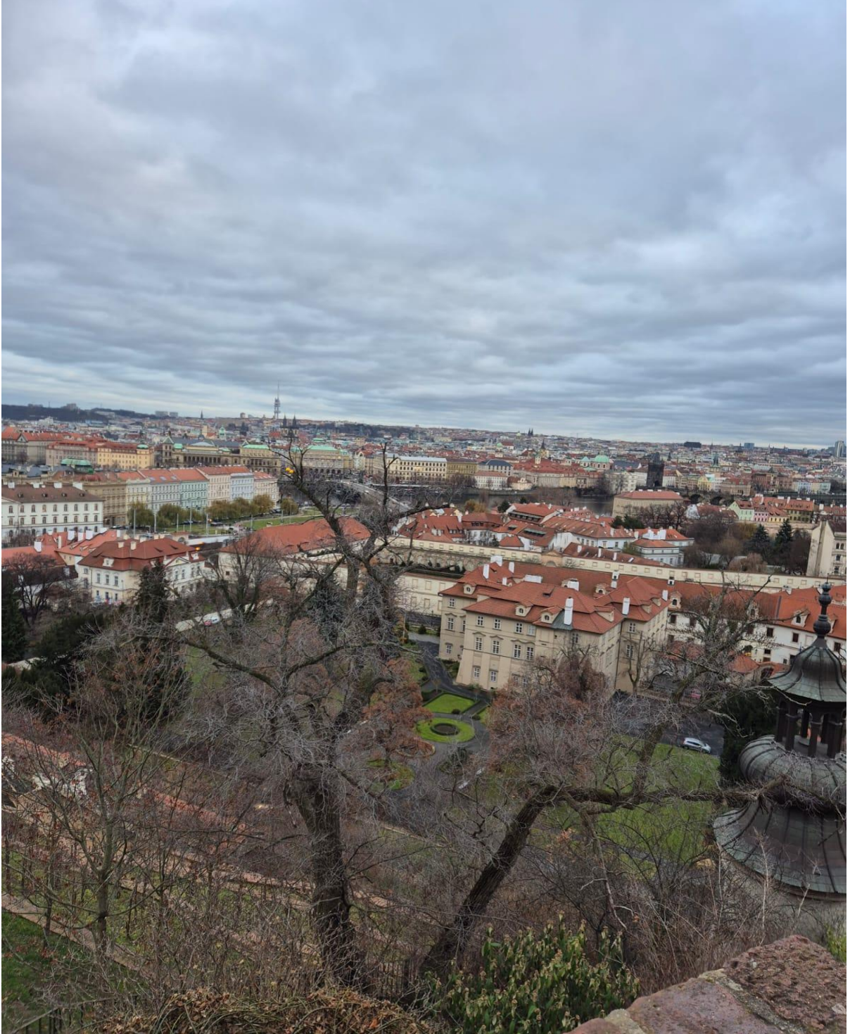
Prag Kalesi'nin (Pražský hrad) çevresinden şehir manzarası (Prag/ÇEKYA)