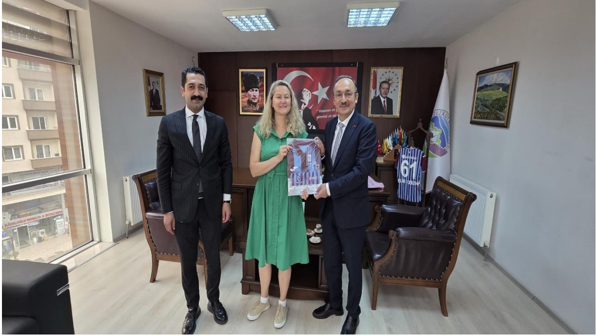
Düzköy Belediye Başkanı Odası (Düzköy/Trabzon/TÜRKİYE)