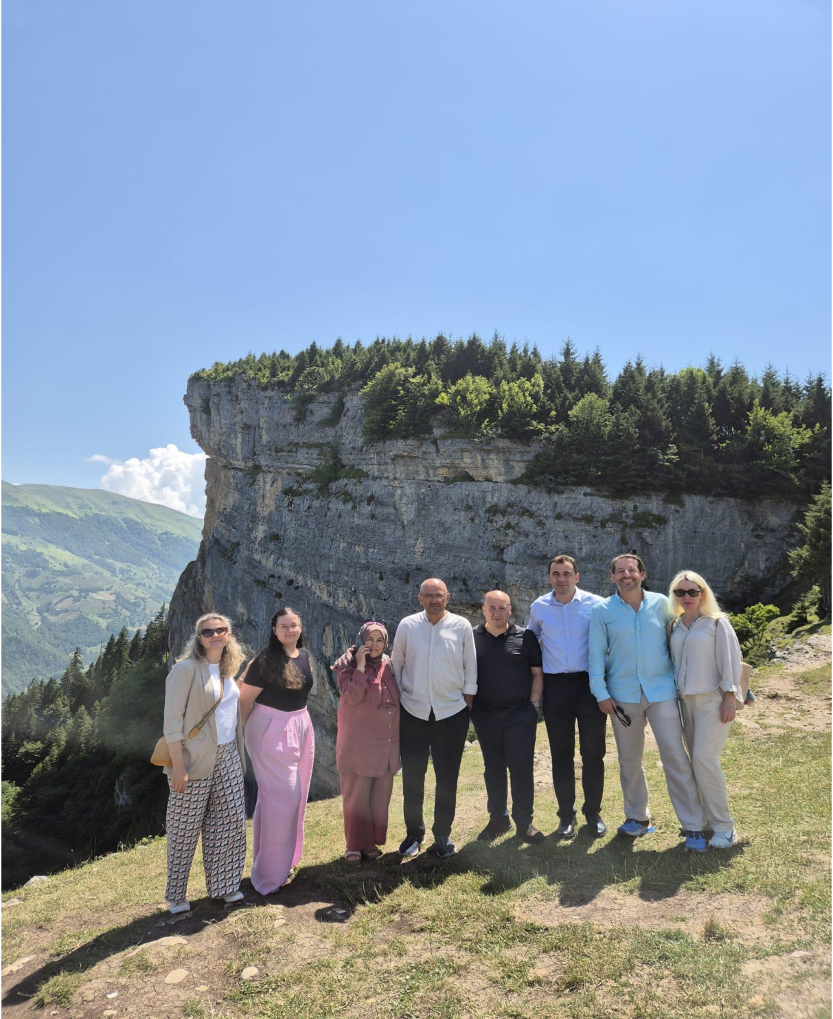
Doğankaya -Şahinkaya (Çayırbağı/Düzköy/Trabzon/TÜRKİYE)