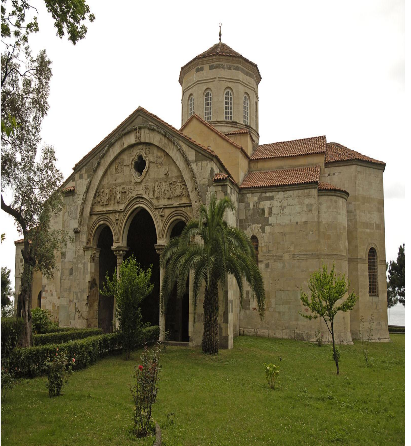
Ayasofya Camii Müzesi (Merkez/Trabzon/TÜRKİYE)