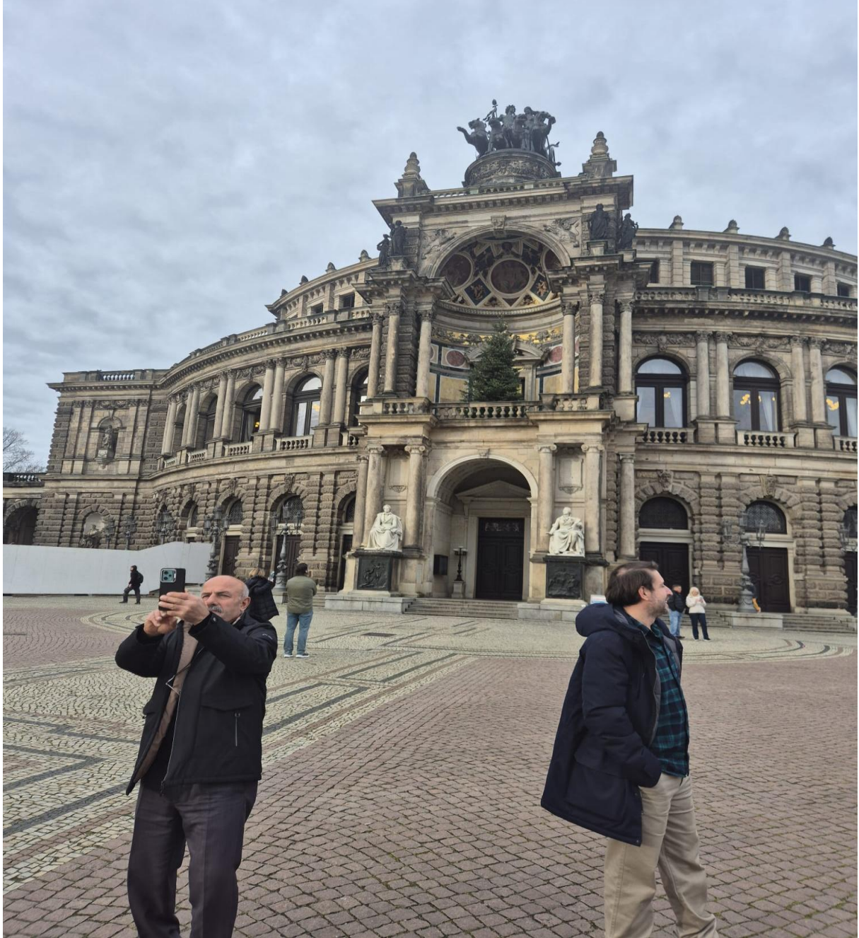
Prag Ulusal Tiyatro (Národní divadlo) (Prag/ÇEKYA)

İkinci ve üçüncü günlerde gerçekleştirilen kültürel geziler, yerel halkla etkileşimler ve gözlem odaklı öğrenme etkinlikleri sayesinde katılımcılar farklı kültürleri deneyimleme fırsatı bulmuştur. Bu süreçte sosyal katılımın artırılması, gönüllülük faaliyetlerinin teşvik edilmesi ve kültürel paylaşımın güçlendirilmesi hedeflenmiştir.