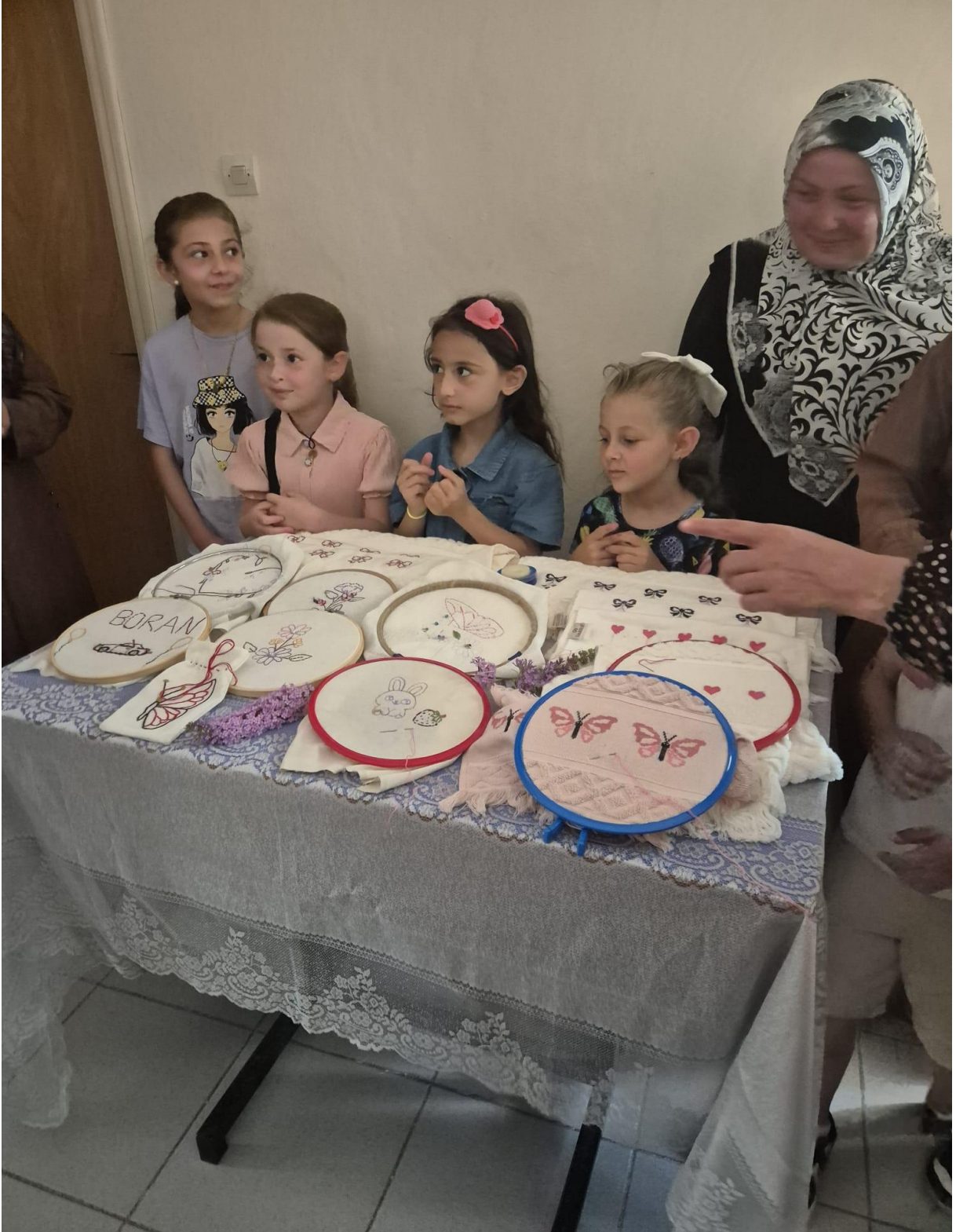
Düzköy Halk Eğitim Merkezi Yöresel Ürünleri(Düzköy/Trabzon/TÜRKİYE)