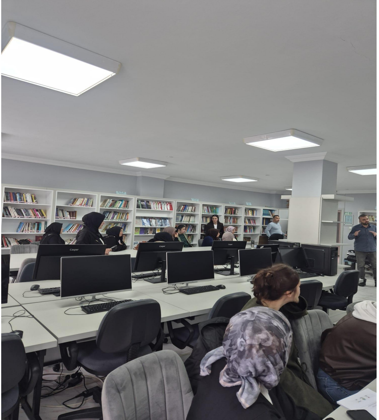
Katılımcı Bireylerin Görselleri (Düzköy/Trabzon/TÜRKİYE)