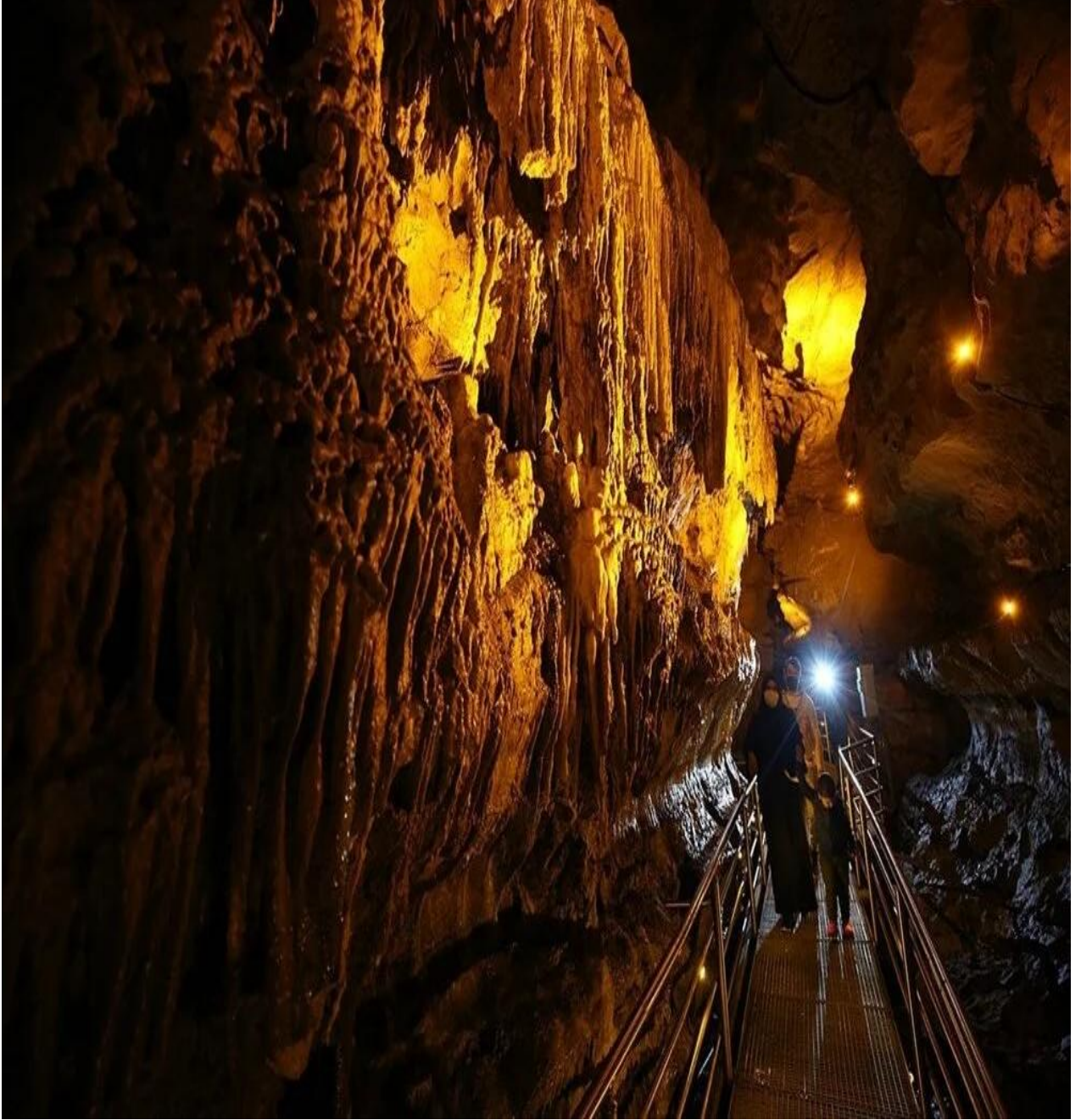
Çal Mağarası (Çalköy/Düzköy/Trabzon/TÜRKİYE)