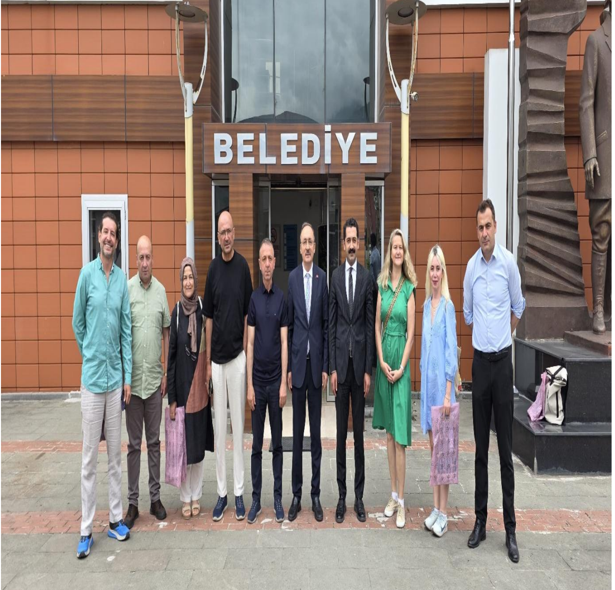
Düzköy Belediyesi (Düzköy/Trabzon/TÜRKİYE)