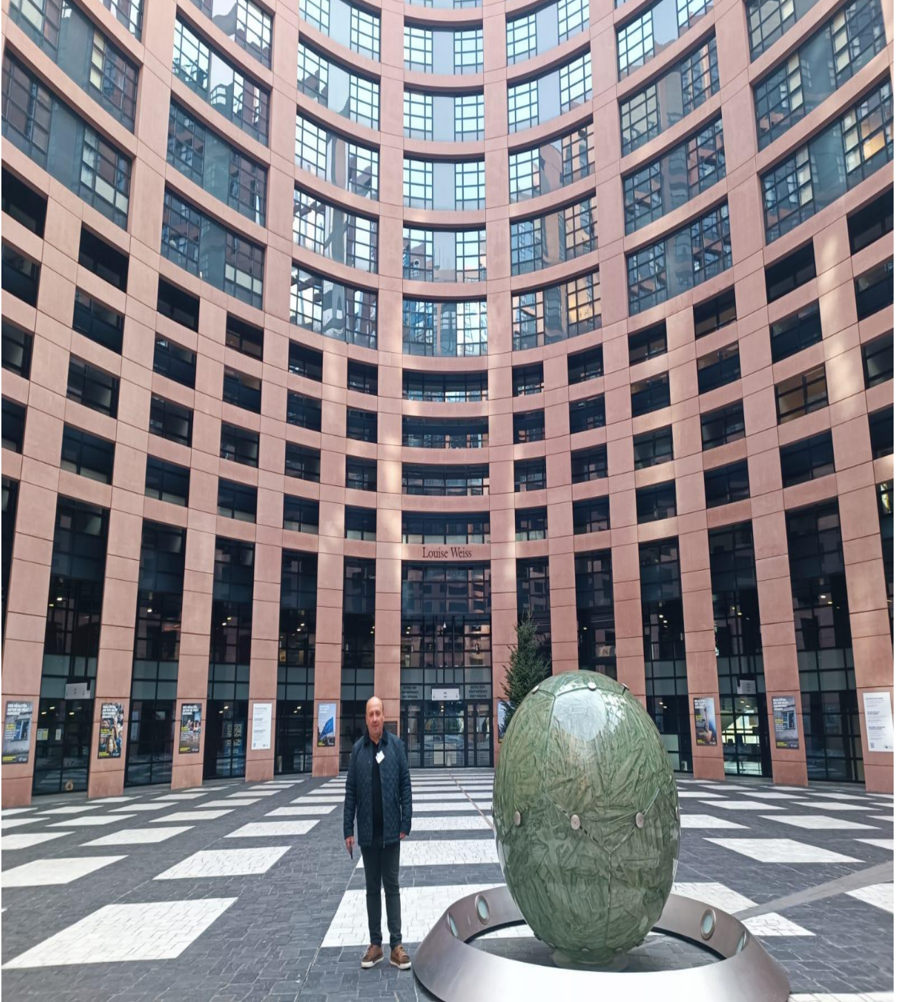
Avrupa Birliđi Binası İinden Görüntü (Strasbourg/FRANSA)