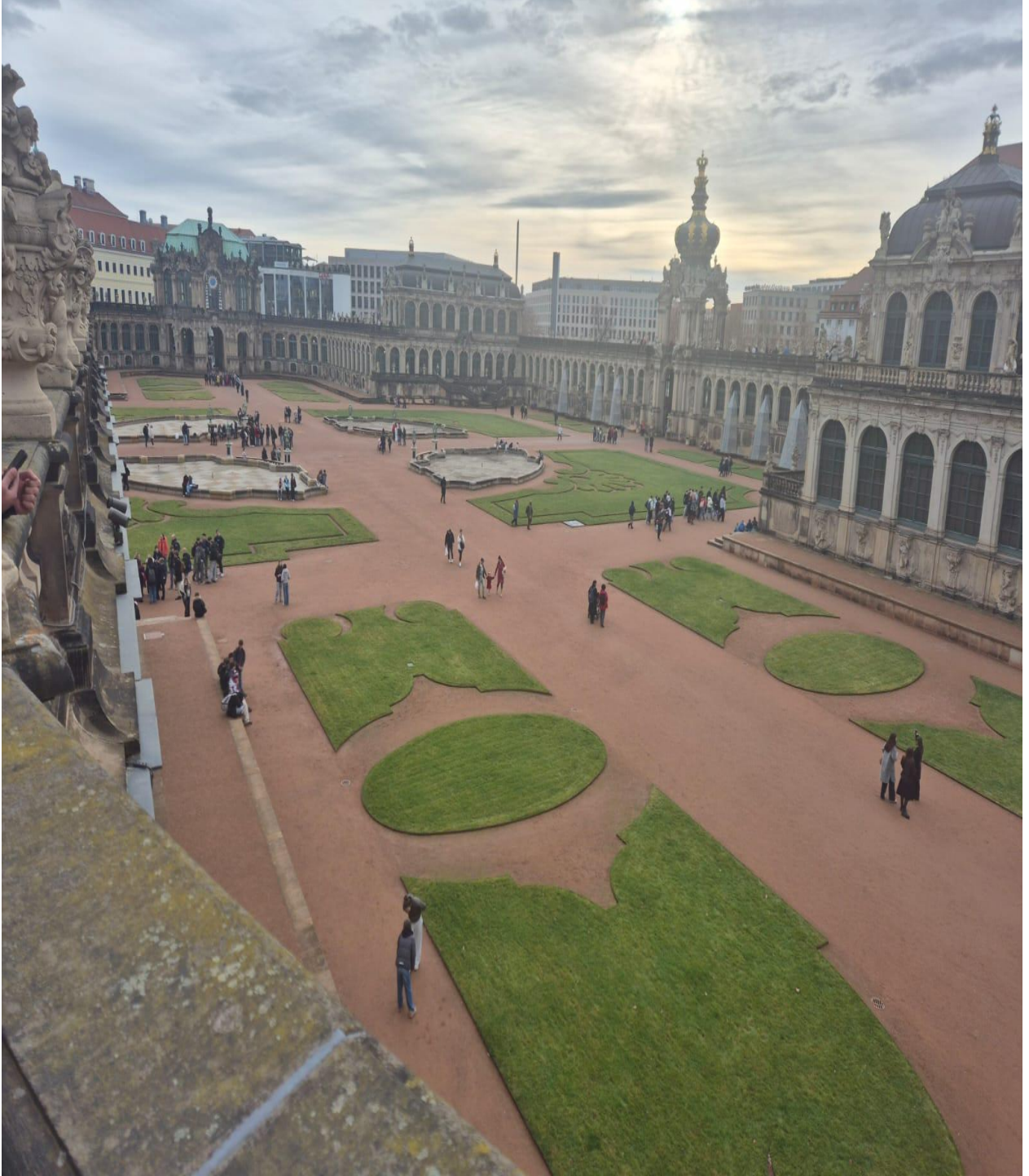
Dresden'deki Zwinger Sarayı (Dresden/ALMANYA)