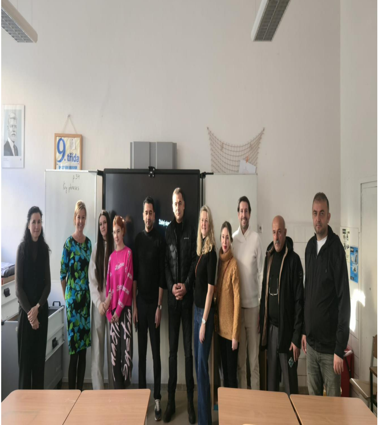
ZS Grafika Okulunun Eğitim Sınıfı Ziyareti (Prag/ÇEKYA)