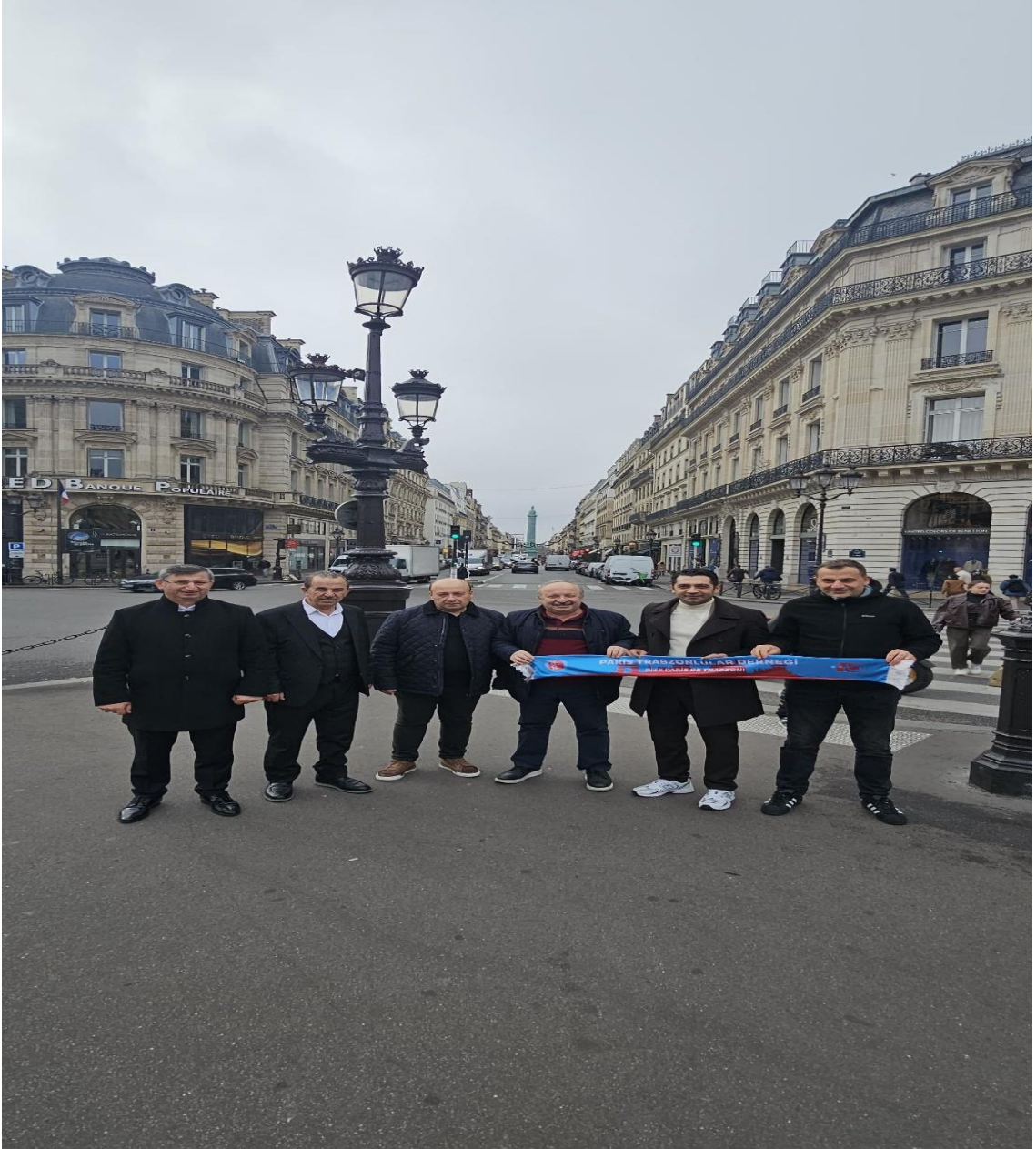
Şanzelize Meydanı Bize Heryer Trabzon ( Paris/FRANSA)

İkinci ve üçüncü günlerde gerçekleştirilen kültürel geziler, yerel halkla etkileşimler ve gözlem odaklı öğrenme etkinlikleri sayesinde katılımcılar farklı kültürleri deneyimleme fırsatı bulmuştur. Bu süreçte sosyal katılımın artırılması, gönüllülük faaliyetlerinin teşvik edilmesi ve kültürel paylaşımın güçlendirilmesi hedeflenmiştir.