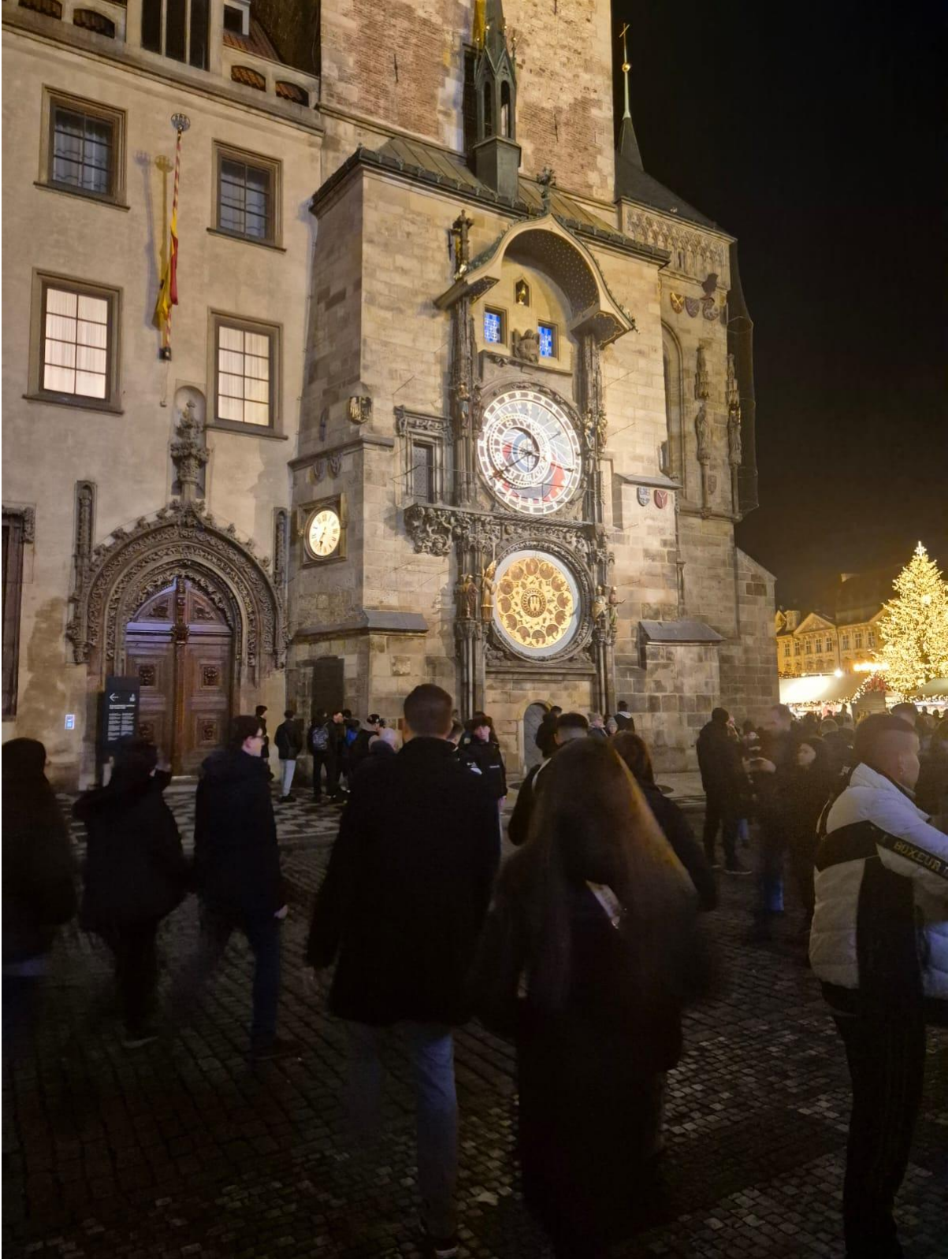
Prag Astronomik Saat (Prag/ÇEKYA)