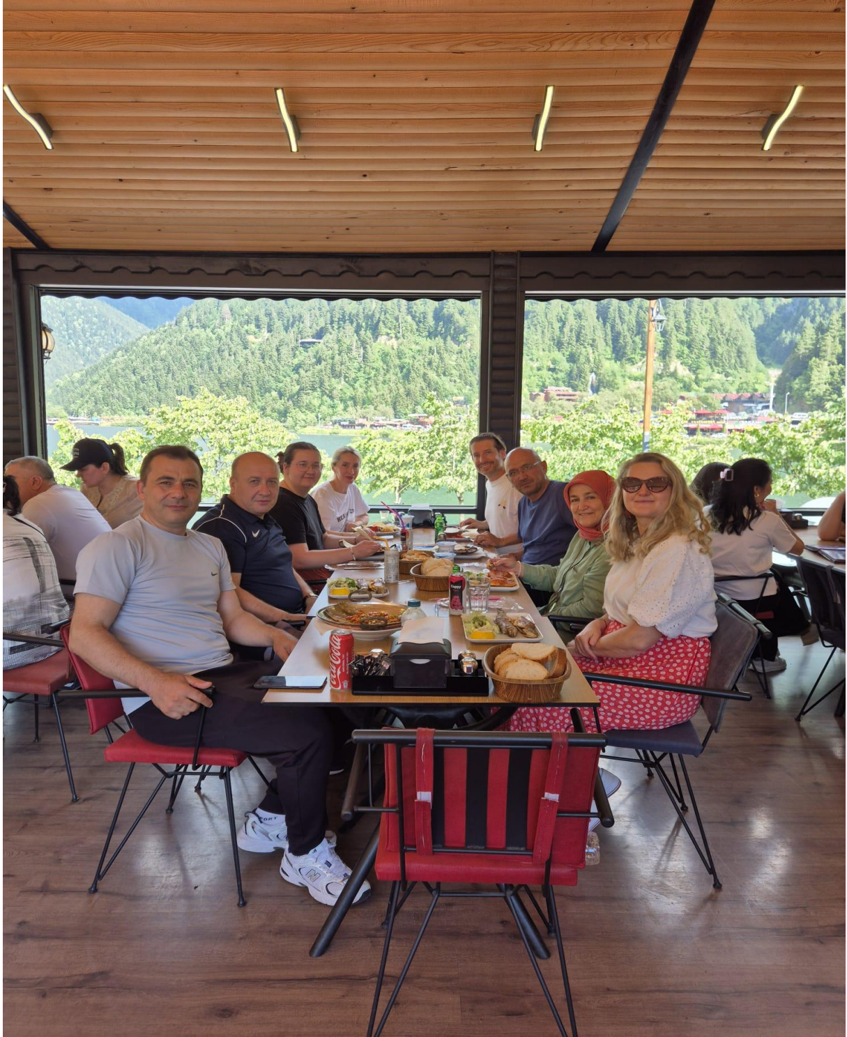
Doğa Restaurant (Uzungöl/Çaykara/Trabzon/TÜRKİYE)