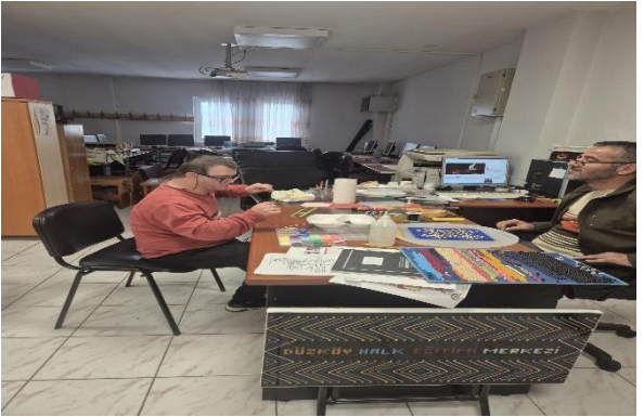
Düzköy Halk Eğitim Merkezi Kursundan Görseller(Düzköy/Trabzon/TÜRKİYE)