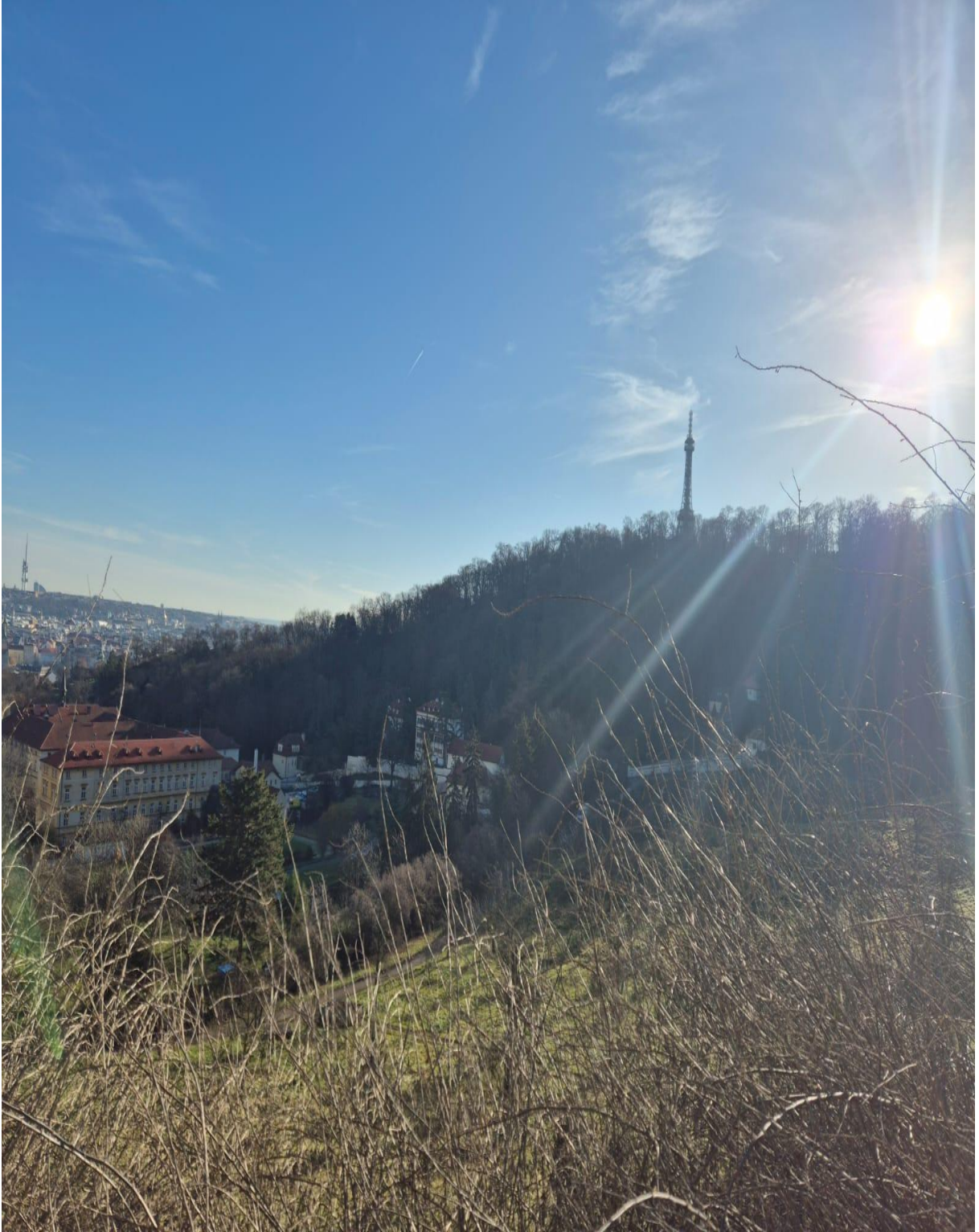
Petřín Güzlem Kulesi (Petřínská rozhledna) (Prag / ÇEKYA)