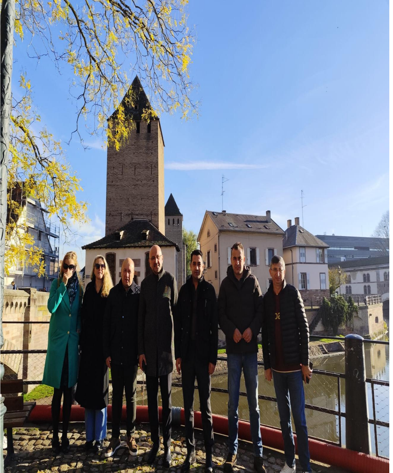
Colmar Bölgesi Tarihi Binaları (Strasbourg/FRANSA)