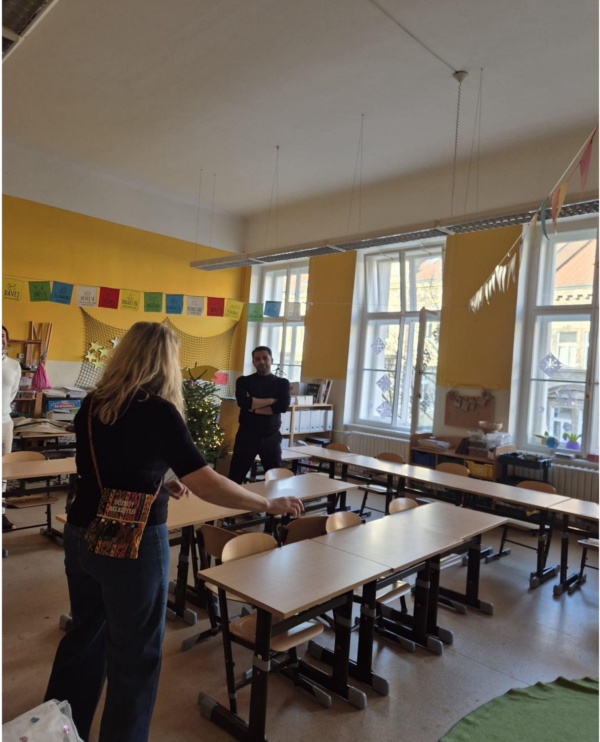
ZS Grafika Okulunda Ana Sınıfı Görseli (Prag/ÇEKYA)