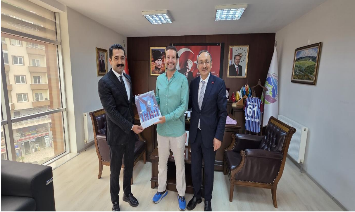
Düzköy Belediye Başkanı Odası (Düzköy/Trabzon/TÜRKİYE)