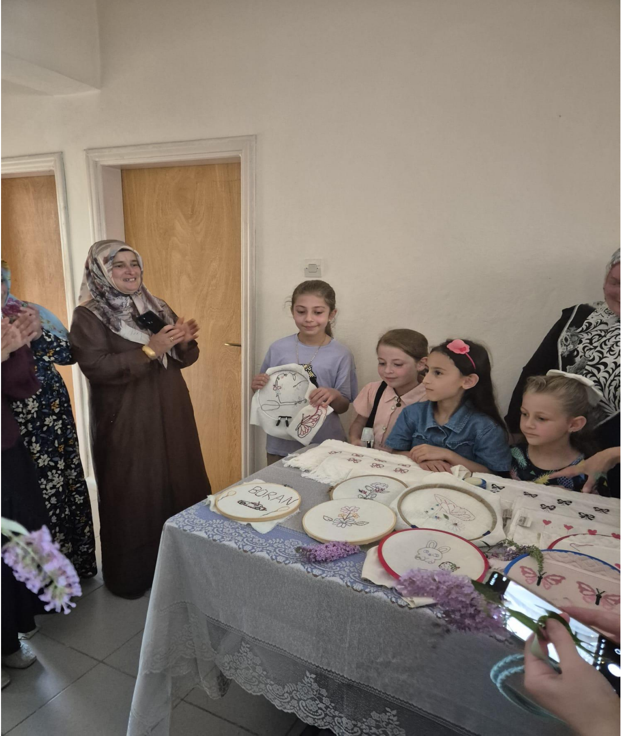
Düzköy Halk Eğitim Merkezi Yöresel Ürünleri(Düzköy/Trabzon/TÜRKİYE)