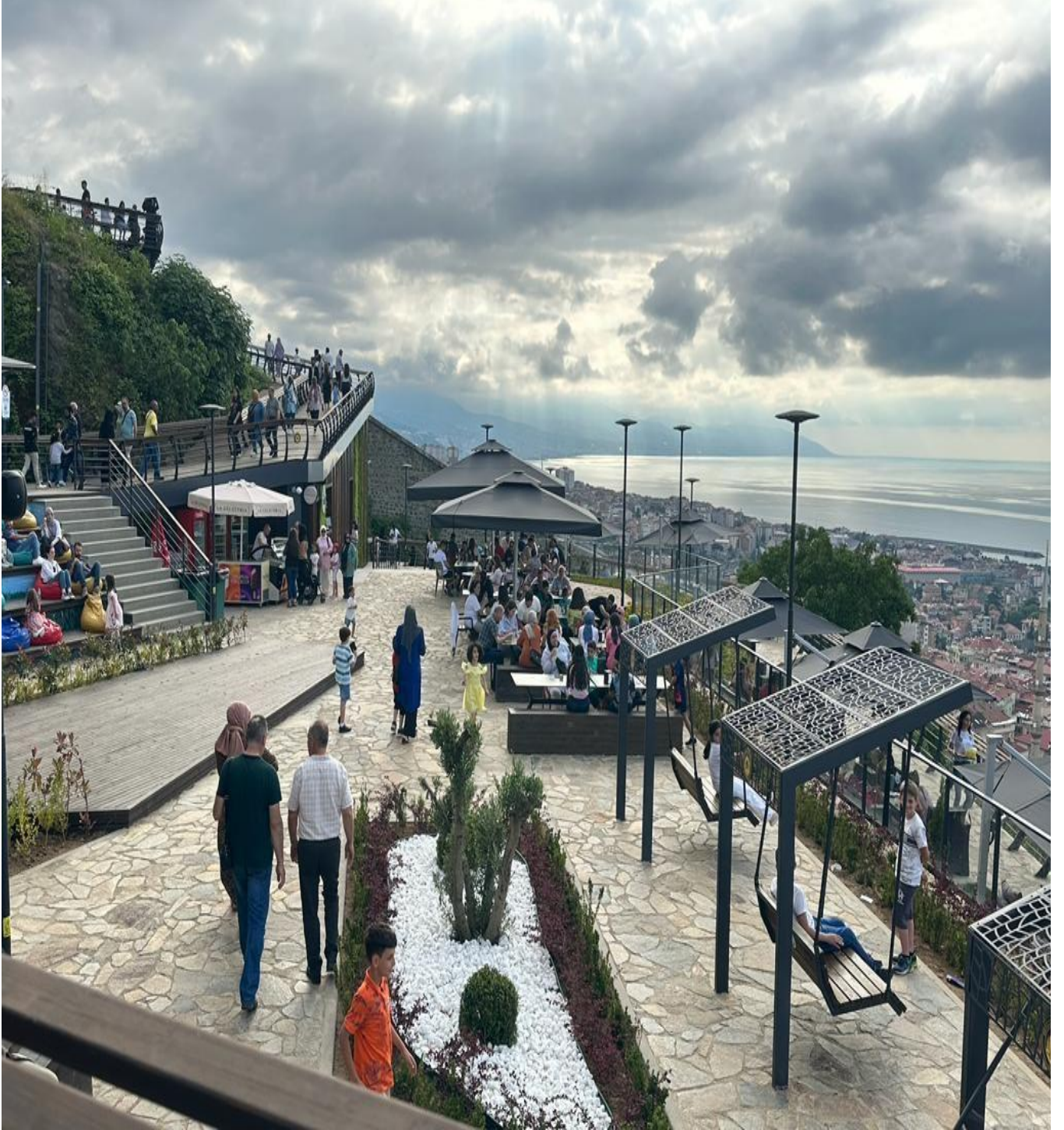
Boztepe Seyir Terası (Merkez/Trabzon/TÜRKİYE)