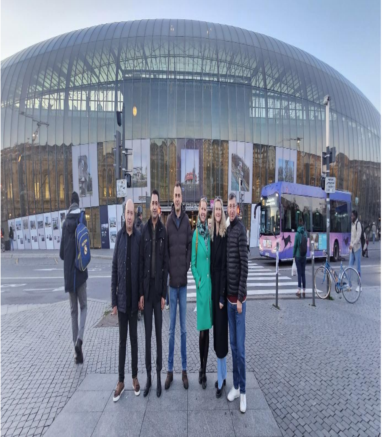
Tren Gari Önü (Strasbourg/FRANSA)