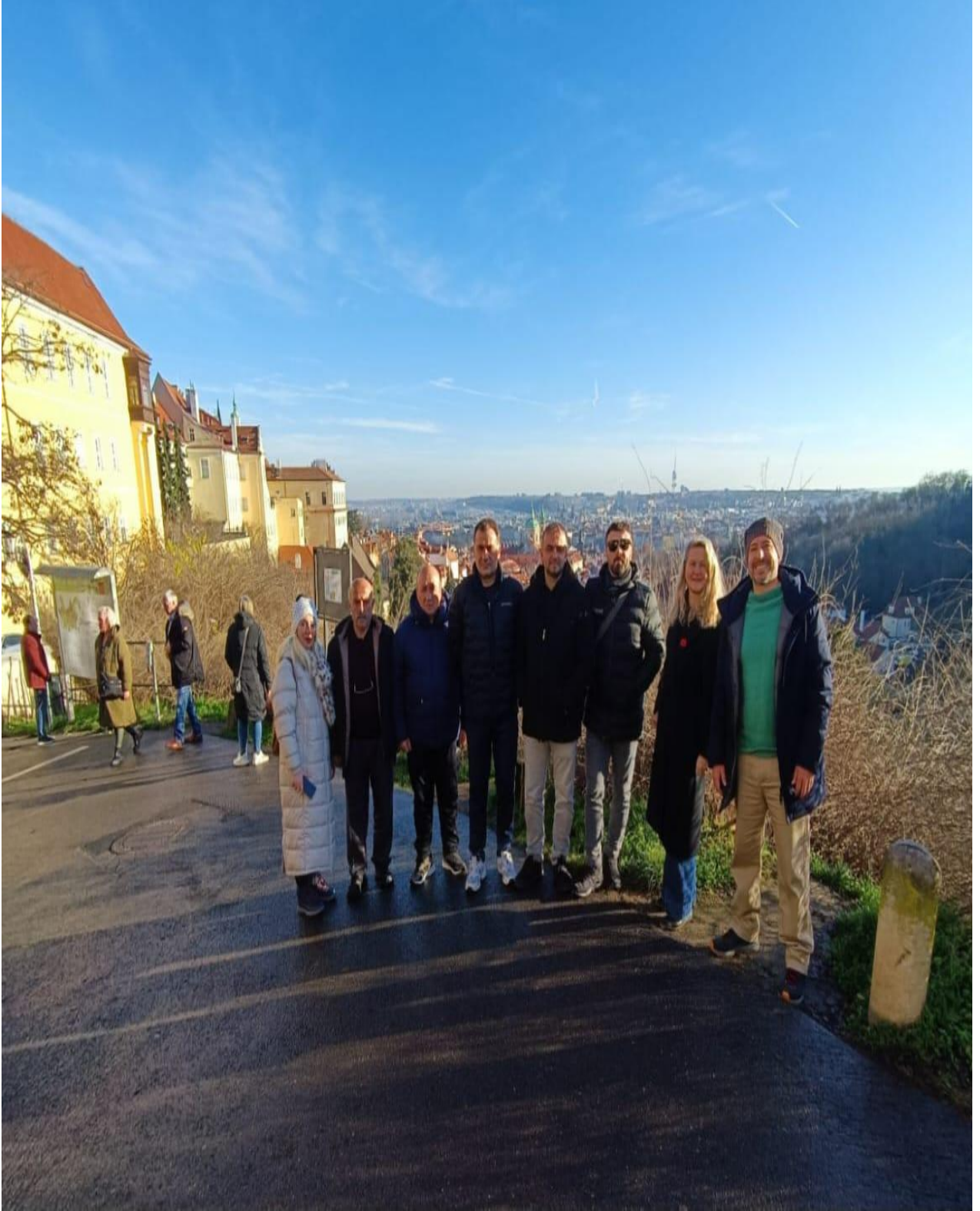
Prag'daki ünlü Letná Parkı'ndan Hanavský Pylonu Çevresi (Prag/ÇEKYA)