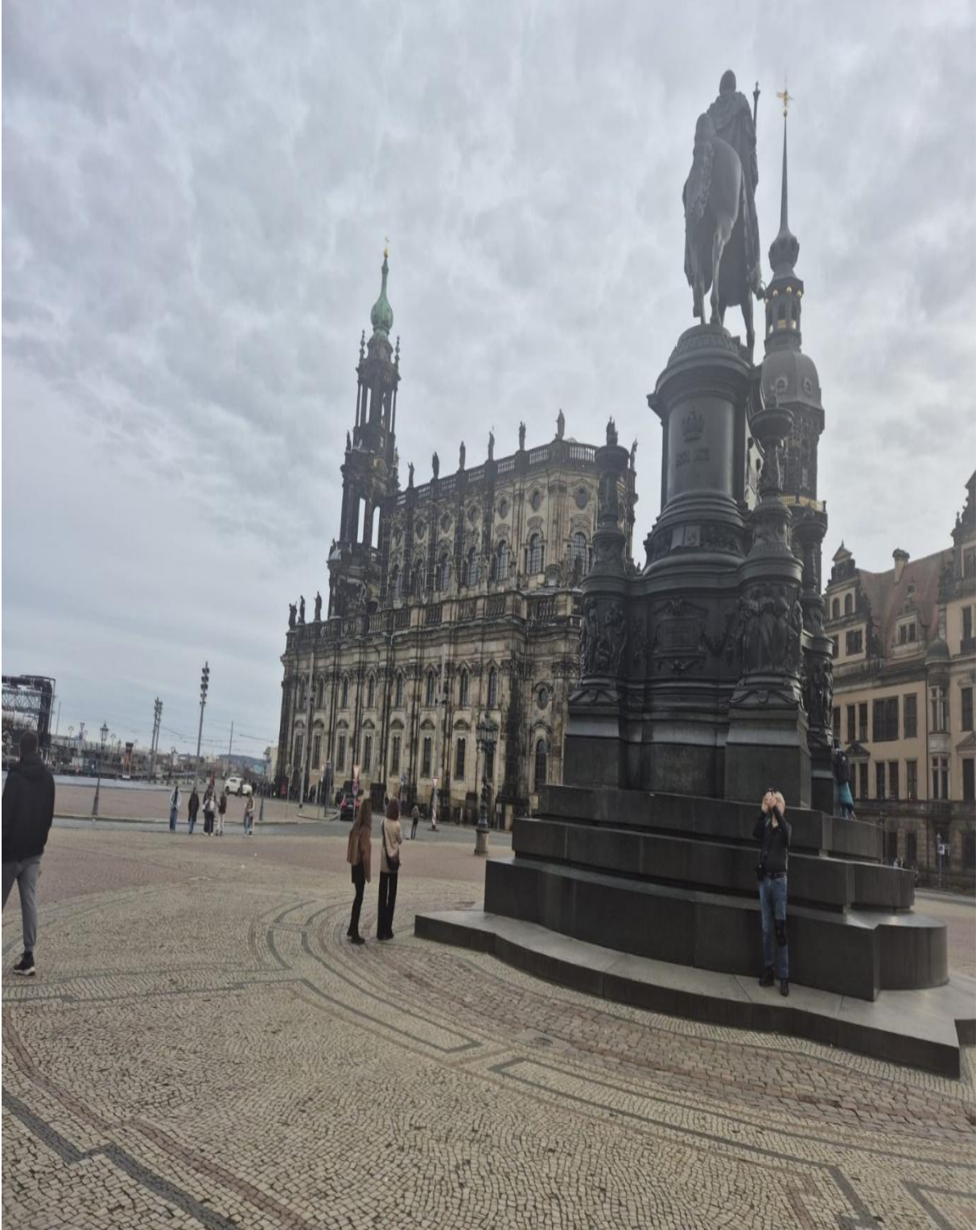
Prag'daki Wenceslas Meydanı Národní Muzesi (Prag/ÇEKYA)