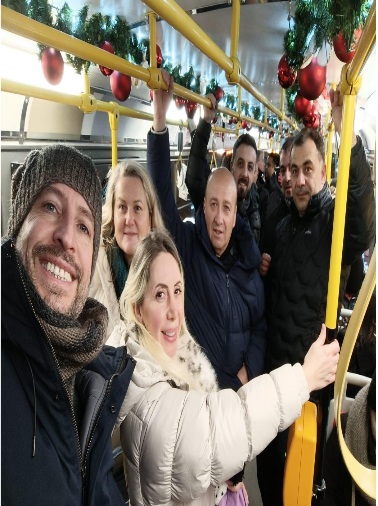
Pragda Metro Seyahati (Prag /ÇEKYA)