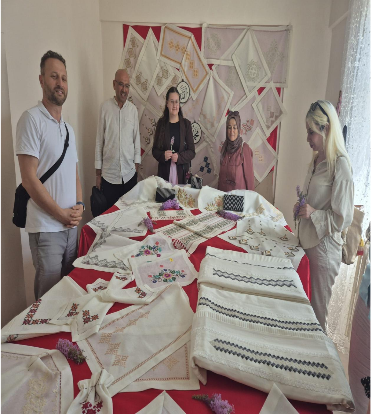
Düzköy Halk Eğitim Merkezi Yöresel Ürünleri(Düzköy/Trabzon/TÜRKİYE)