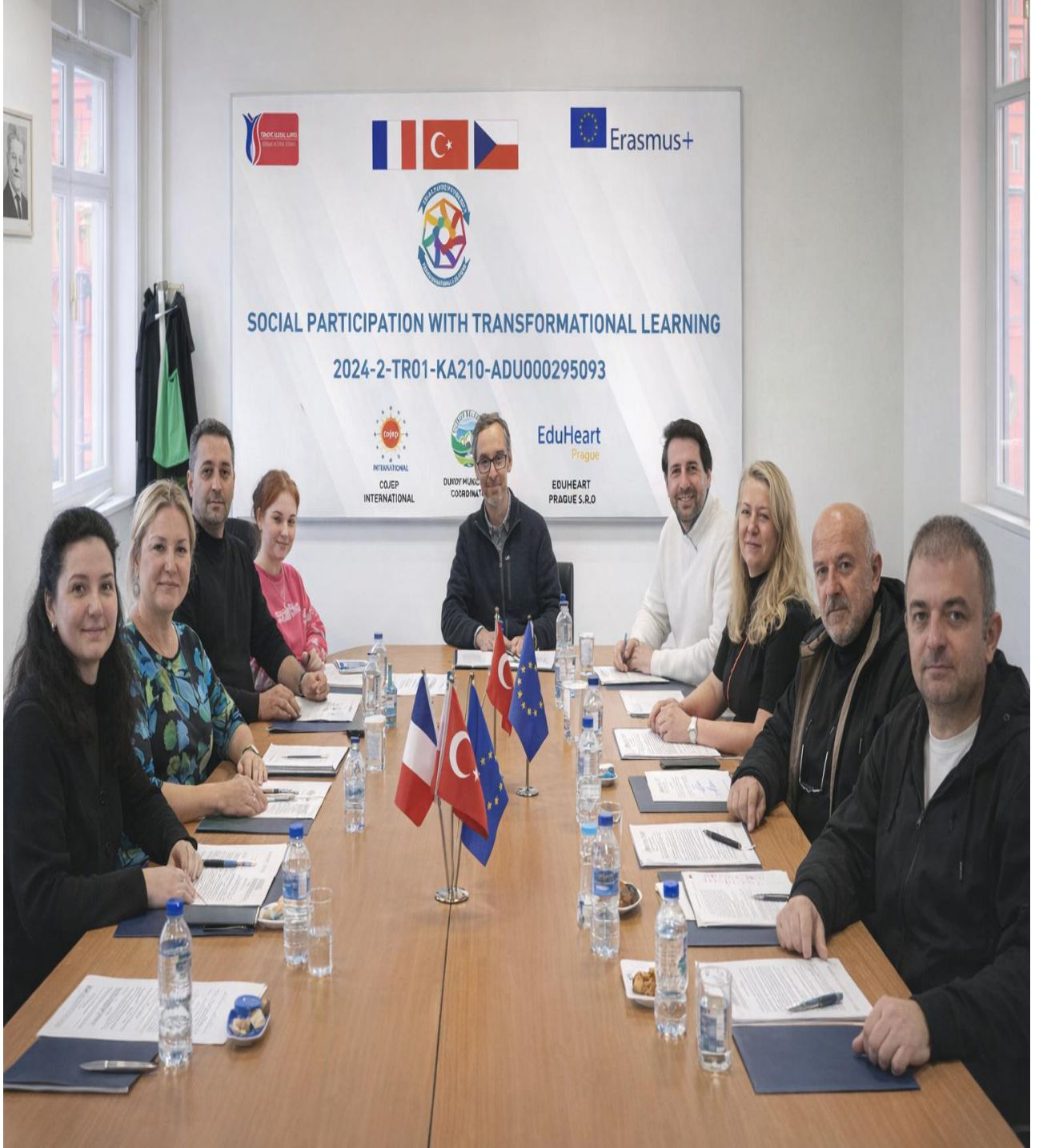
Mestska Cast Praha 5 Belediyesine Ziyaret (Prag/ÇEKYA)