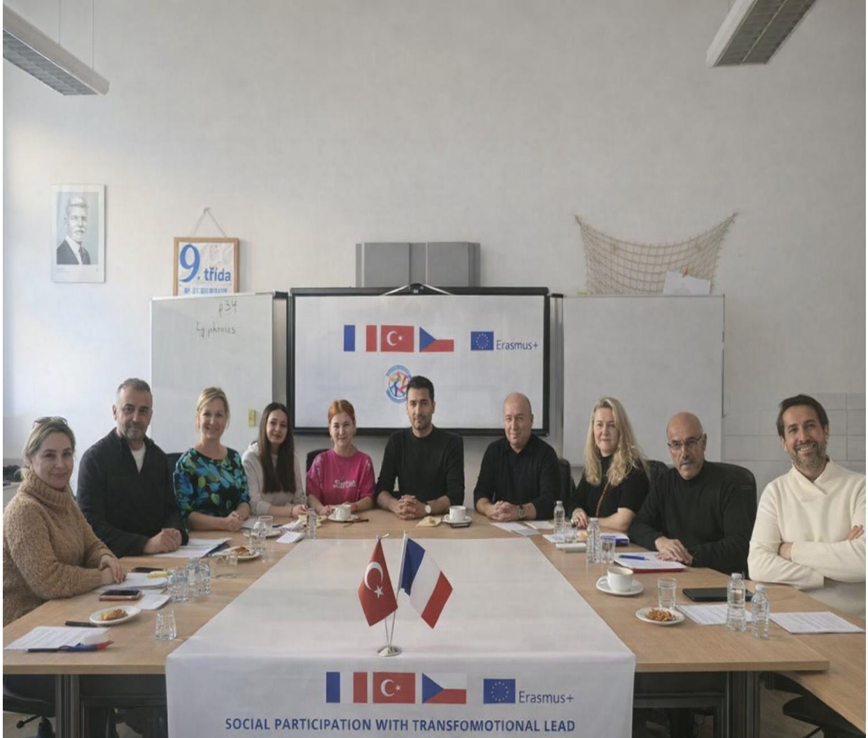
Belediye, EduHeart ve Cojep Ekipi Tarafından ZS Grafika Okulunda Toplantı (Prag/ÇEKYA)

Prag ziyaretinin ilk gününde ortaklarla yapılan çalışmalarda kapsayıcı eğitim, kültürlerarası etkileşim ve sosyal katılım hedefleri vurgulanmıştır. Katılımcıların uluslararası deneyim kazanması ve yerel toplulukların projeden faydalanması planlanmıştır. Bu amaçlar doğrultusunda kurum ziyaretleri yapılmıştır.