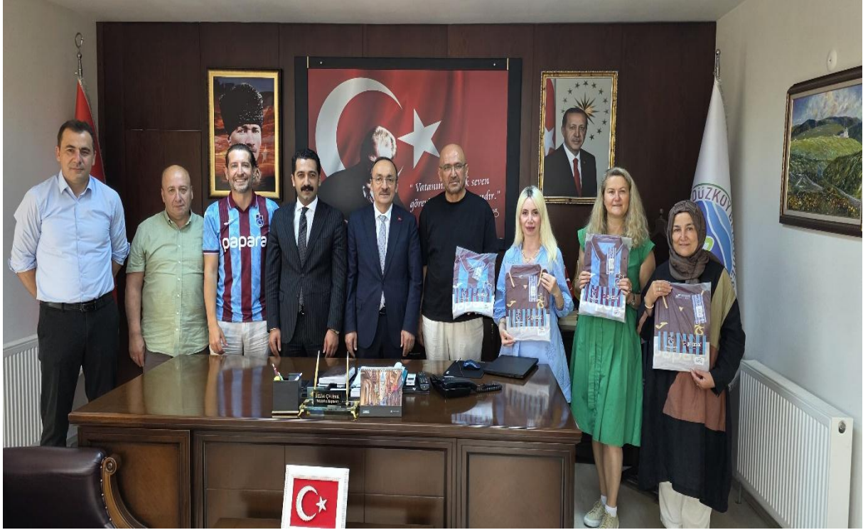
Düzköy Belediye Başkanı Odası (Düzköy/Trabzon/TÜRKİYE)