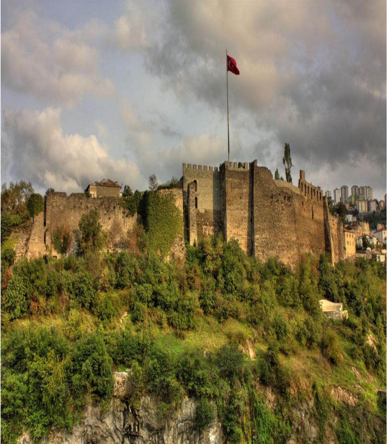
Trabzon Kalesi (Merkez/Trabzon/TÜRKİYE)