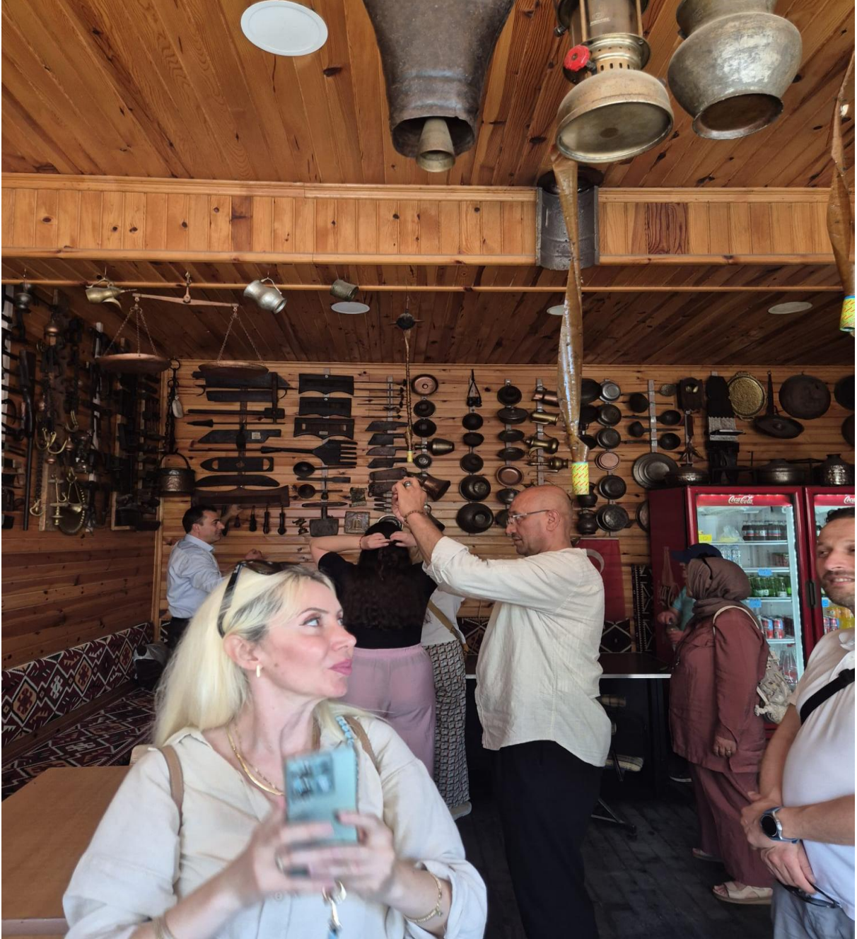
Tarihi Eşyalar Müzesi (Aykut/Düzköy/Trabzon/TÜRKİYE)