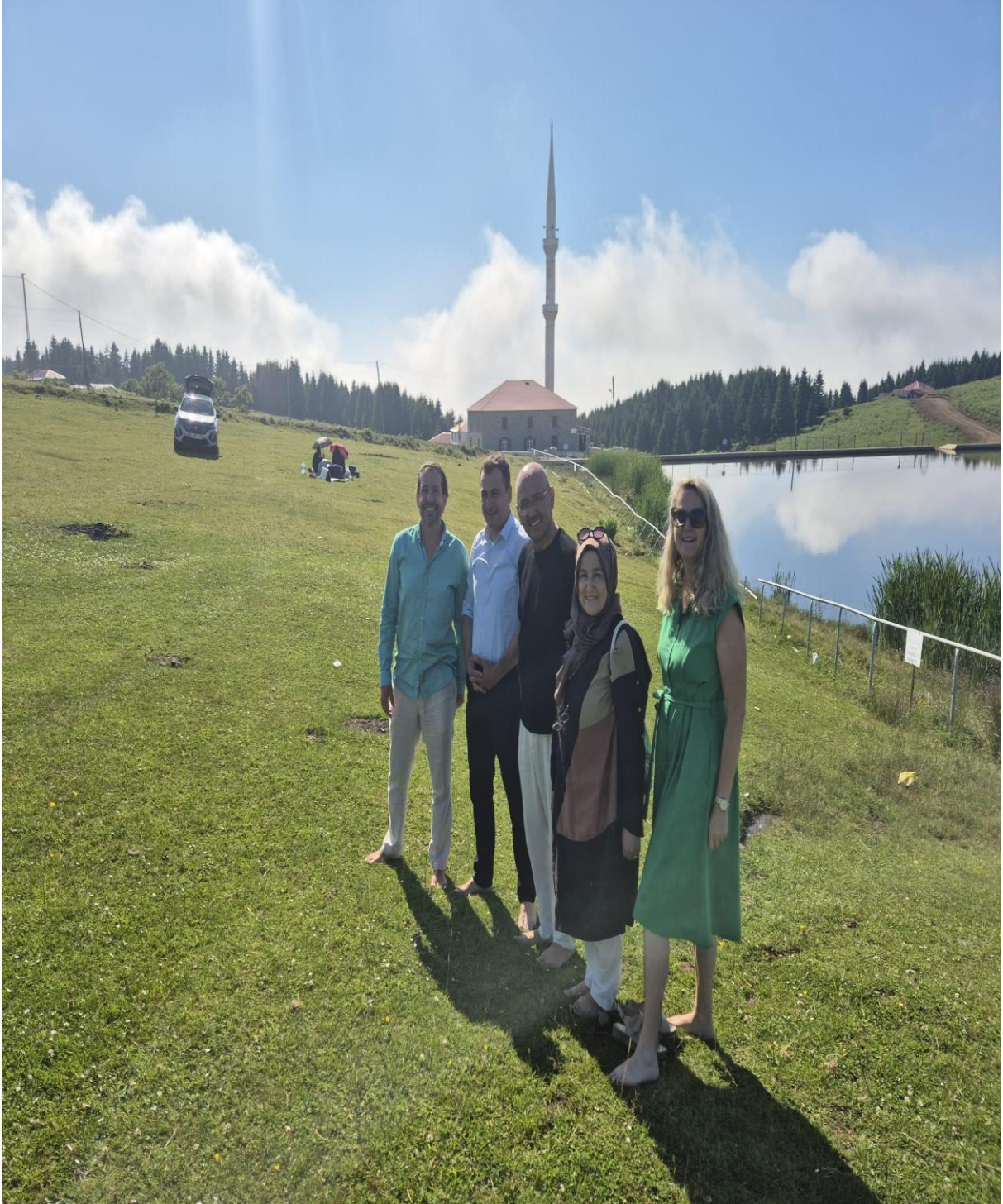
Hirsafa Yaylası (Çalköy/Düzköy/Trabzon/TÜRKİYE)