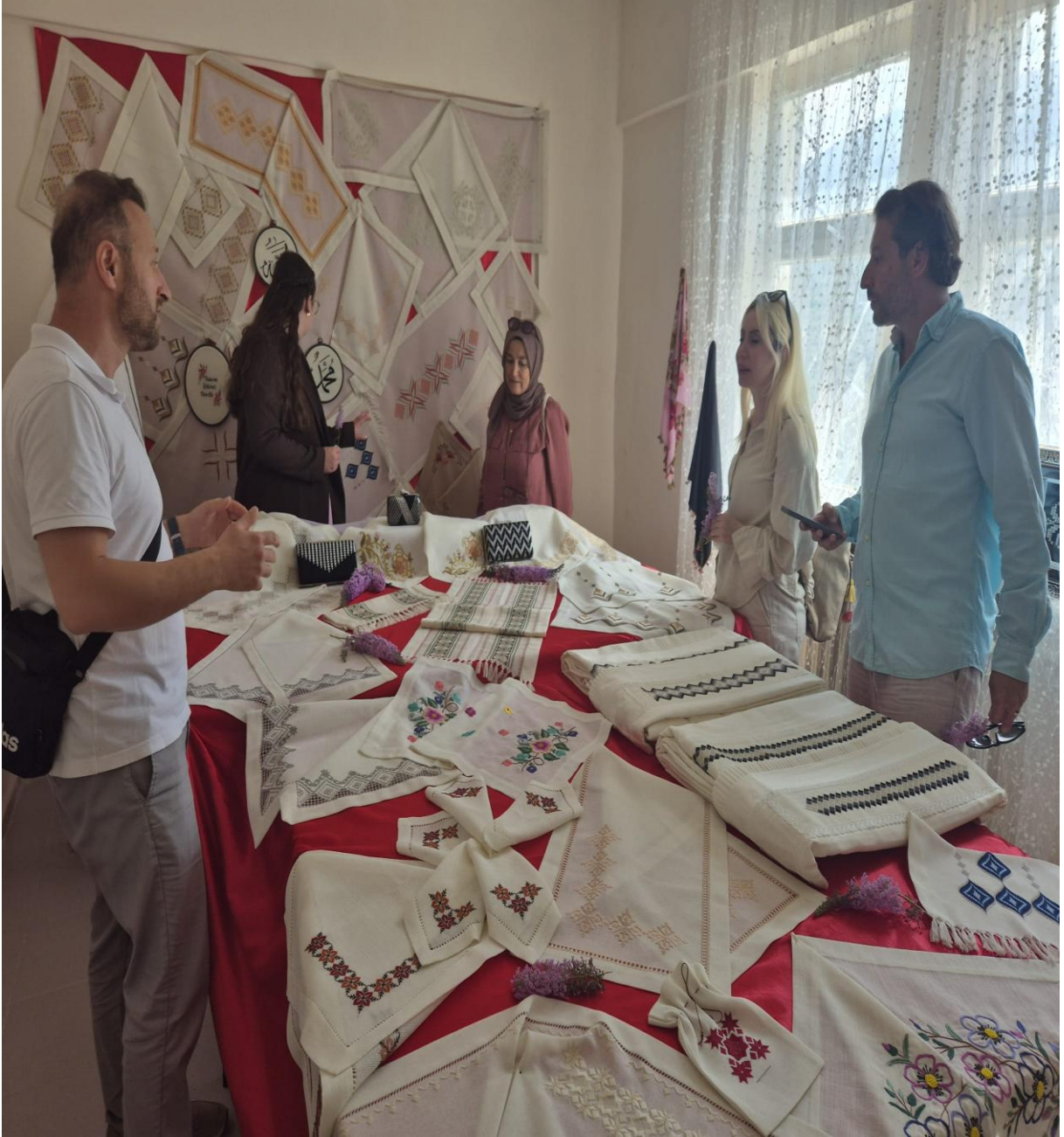
Düzköy Halk Eğitim Merkezi Yöresel Ürünleri (Düzköy/Trabzon/TÜRKİYE)