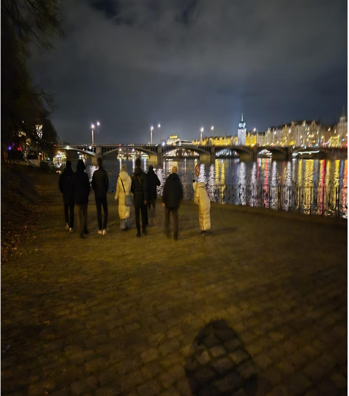
Nehir Kenarı Gece Görüntüsü (Prag/ÇEKYA)