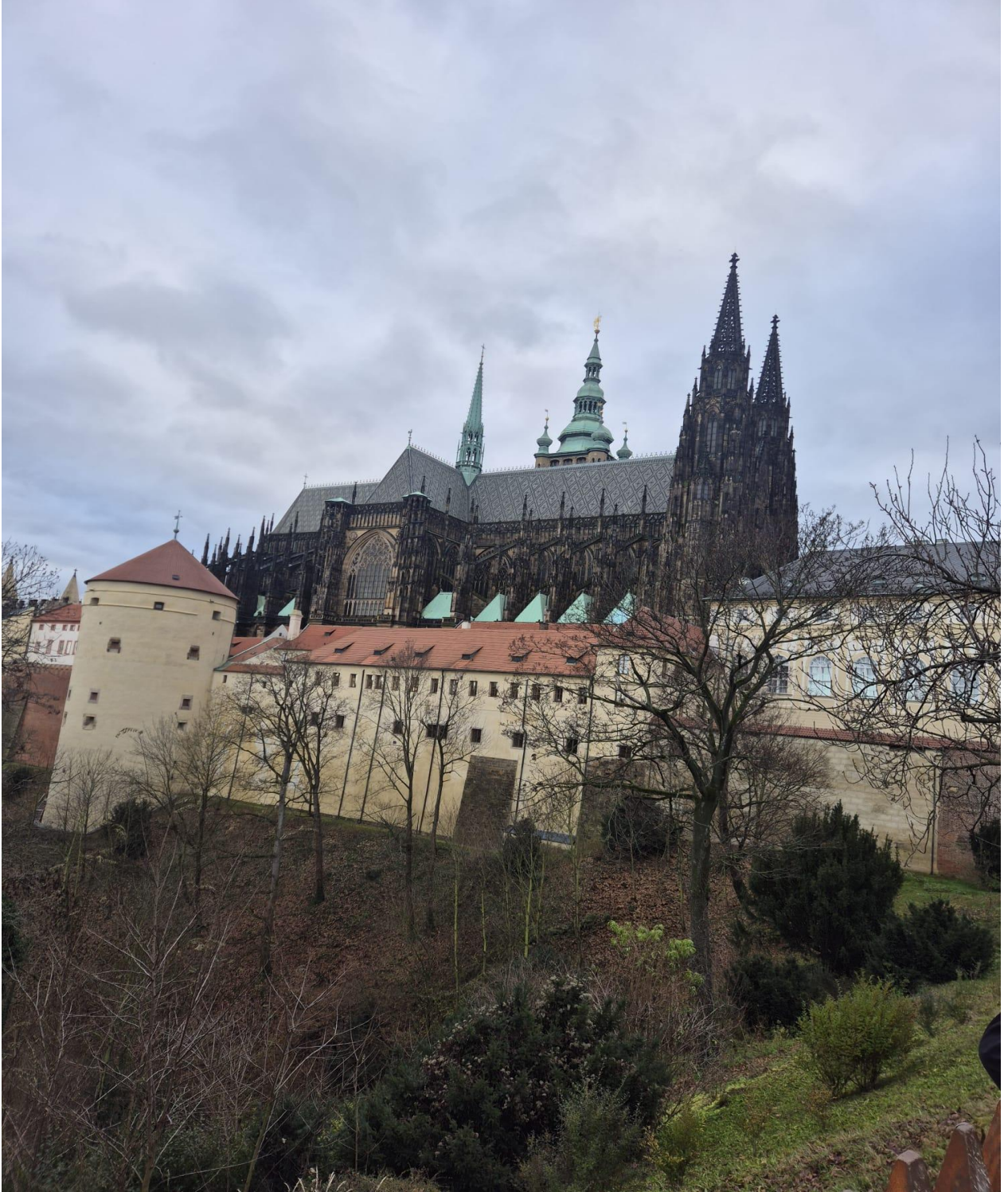
Prag Kalesi (Pražský hrad) içindeki St. Vitus Katedrali (Prag/ÇEKYA)