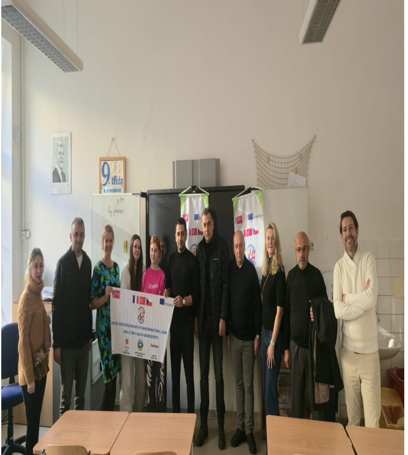
ZS Grafika Okulunun Eğitim Sınıfından Katılımcıların Görseli (Prag/ÇEKYA)