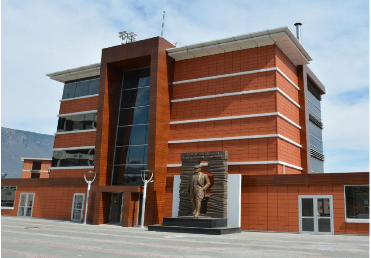
Düzköy Belediyesi (Düzköy/Trabzon/Türkiye)

Bu projenin temel taşı, yetişkin bireylerin sosyal hayata katılımını artırırken öğrenme süreçlerini daha anlamlı hale getirmektir. Sadece bilgi aktarımı değil; eleştirel düşünme, kişisel farkındalık ve sosyal sorumluluk bilinci kazandırmak hedeflenmektedir. Yetişkin eğitimindeki klasik yöntemlerin ötesine geçerek, bireylerin düşünce yapısını değiştiren "dönüşümsel öğrenme" yaklaşımı eğitim sistemine entegre edilmektedir