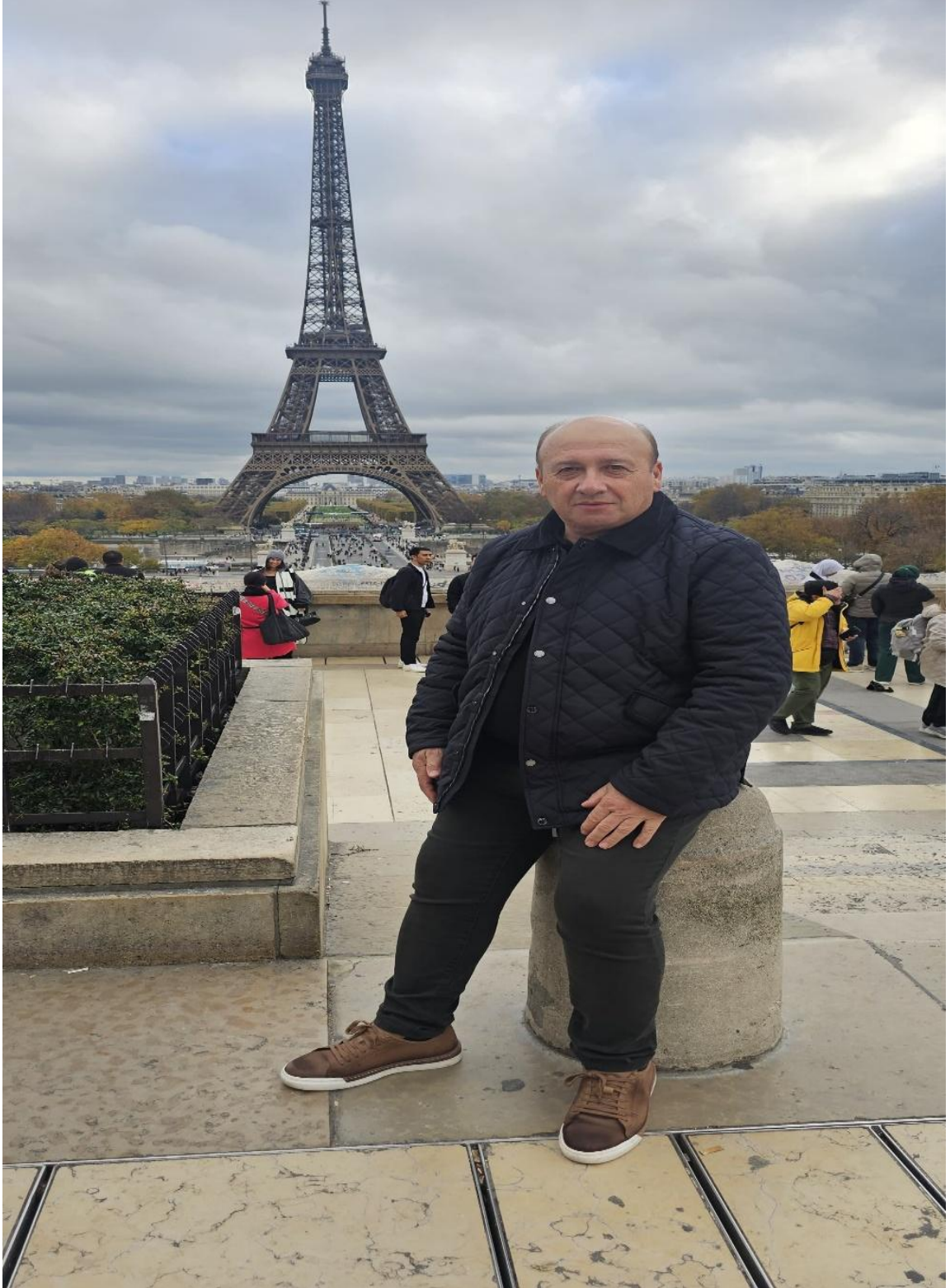
Eyfel Kulesi Önü (Paris/FRANSA)