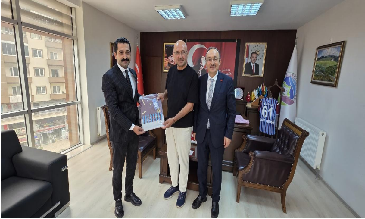
Düzköy Belediye Başkanı Odası (Düzköy/Trabzon/TÜRKİYE)