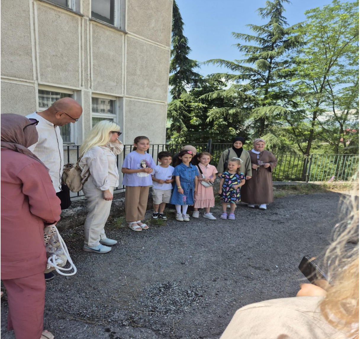
Düzköy Halk Eğitim Merkezi Binası Önü (Düzköy/Trabzon/TÜRKİYE)

Açılış toplantısının ardından Halk Eğitim Merkezi ziyaret edilerek, kursiyerlerin el emeği ürünleri incelenmiştir. Bu ziyaret, projenin yerel topluluklarla bağ kurma sürecini somutlaştırmıştır.