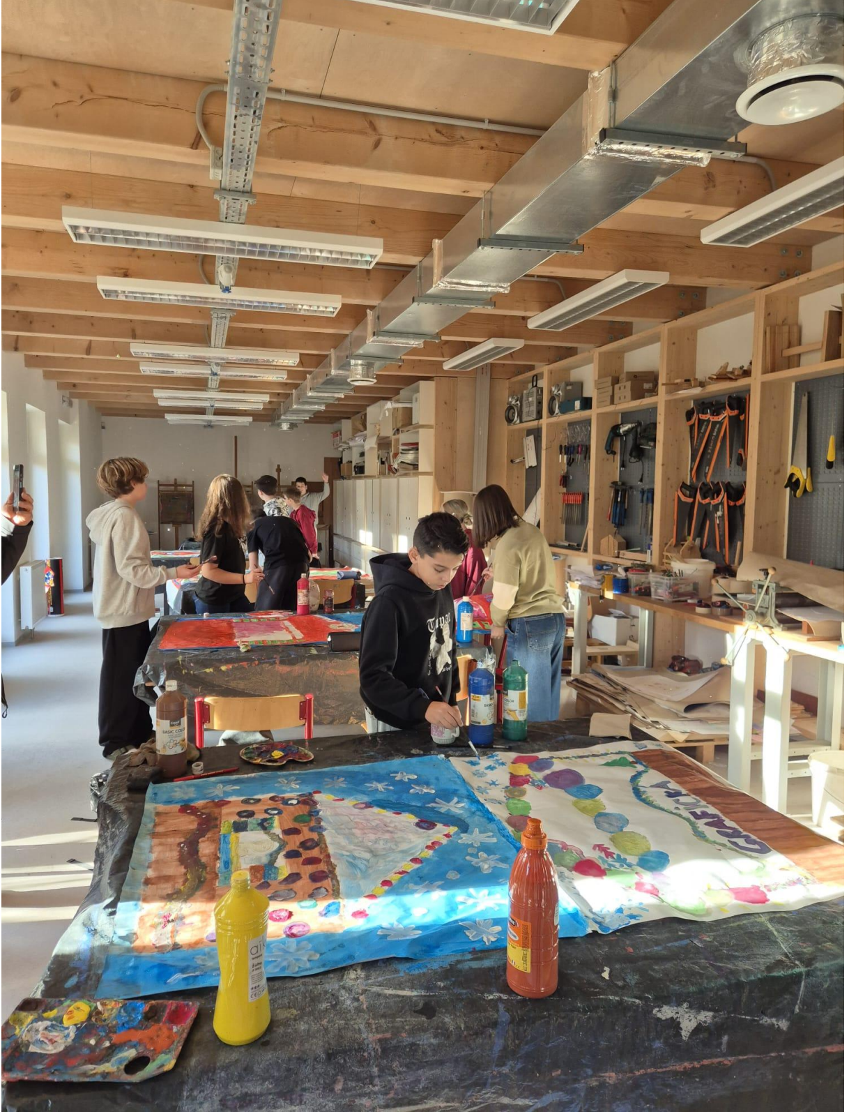
ZS Grafika Okulunun Atölye Eğitim Sınıfı Ziyareti (Prag/ÇEKYA)