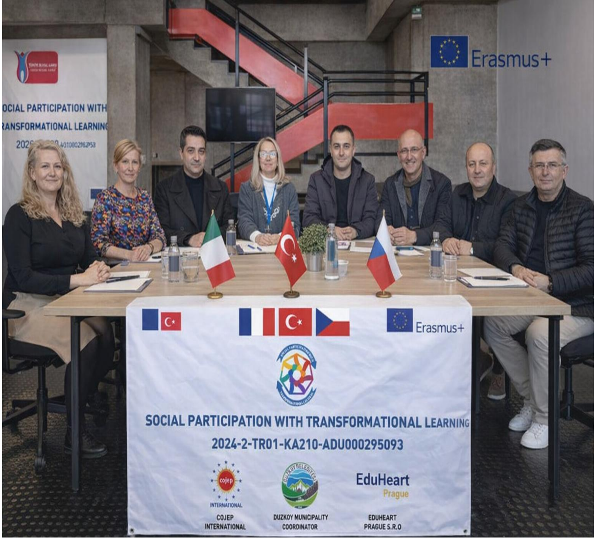
Avrupa Birliği Toplantı Salonu (Strasbourg/FRANSA)

Strasbourg ziyaretinin ilk gününde ortaklarla yapılan çalışmalarda kapsayıcı eğitim, kültürlerarası etkileşim ve sosyal katılım hedefleri vurgulanmıştır. Katılımcıların uluslararası deneyim kazanması ve yerel toplulukların projeden faydalanması planlanmıştır. Bu amaçlar doğrultusunda kurum ziyaretleri yapılmıştır.