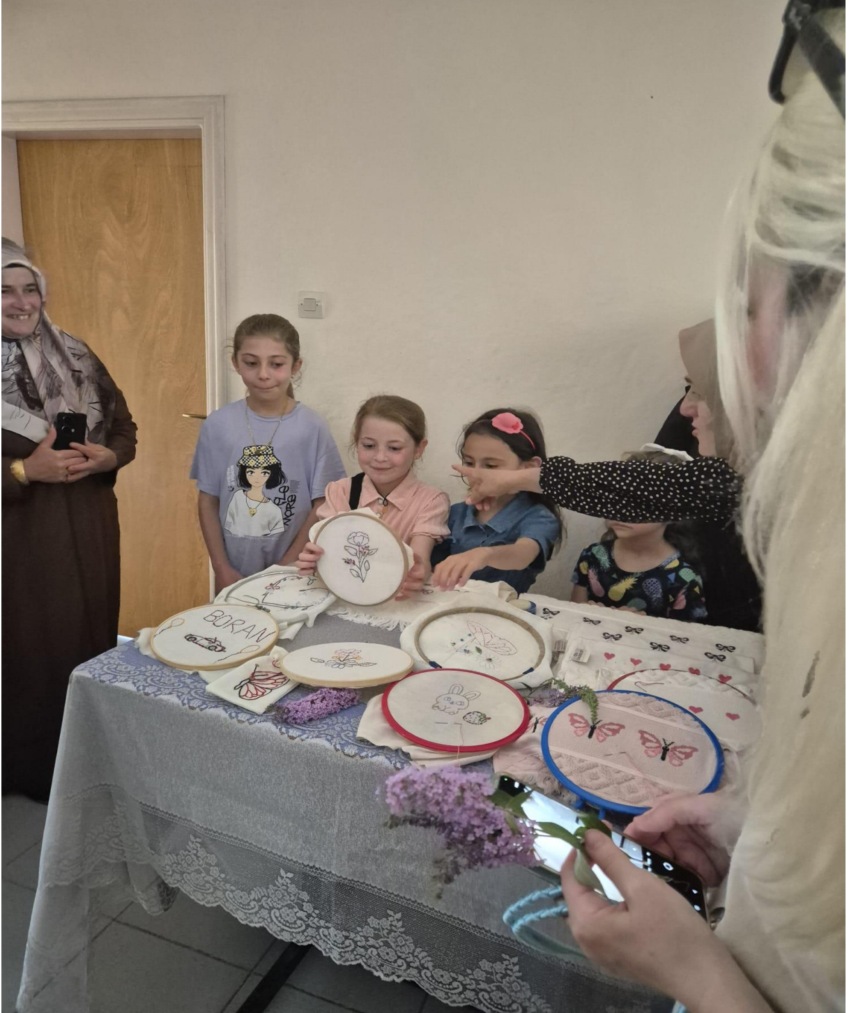
Düzköy Halk Eğitim Merkezi Yöresel Ürünleri(Düzköy/Trabzon/TÜRKİYE)