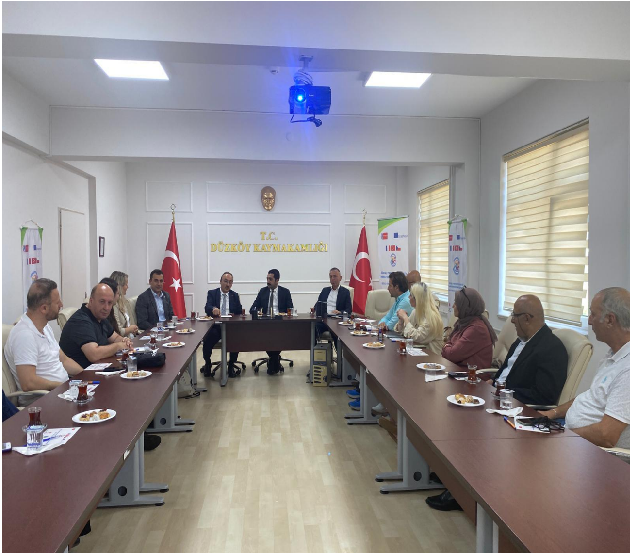
Düzköy Kaymakamlığı Toplantı Salonu (Düzköy/Trabzon/TÜRKİYE)

Düzköy Kaymakamlığı Toplantı Salonu'nda gerçekleştirilen açılış toplantısına Türkiye (Düzköy), Çekya (Prag) ve Fransa (Strasbourg) ortakları katılım sağlamıştır. Toplantıda Düzköy Kaymakamı, Belediye Başkanı, Milli Eğitim ve Halk Eğitim müdürleri ile kursiyerler bir araya gelmiştir.