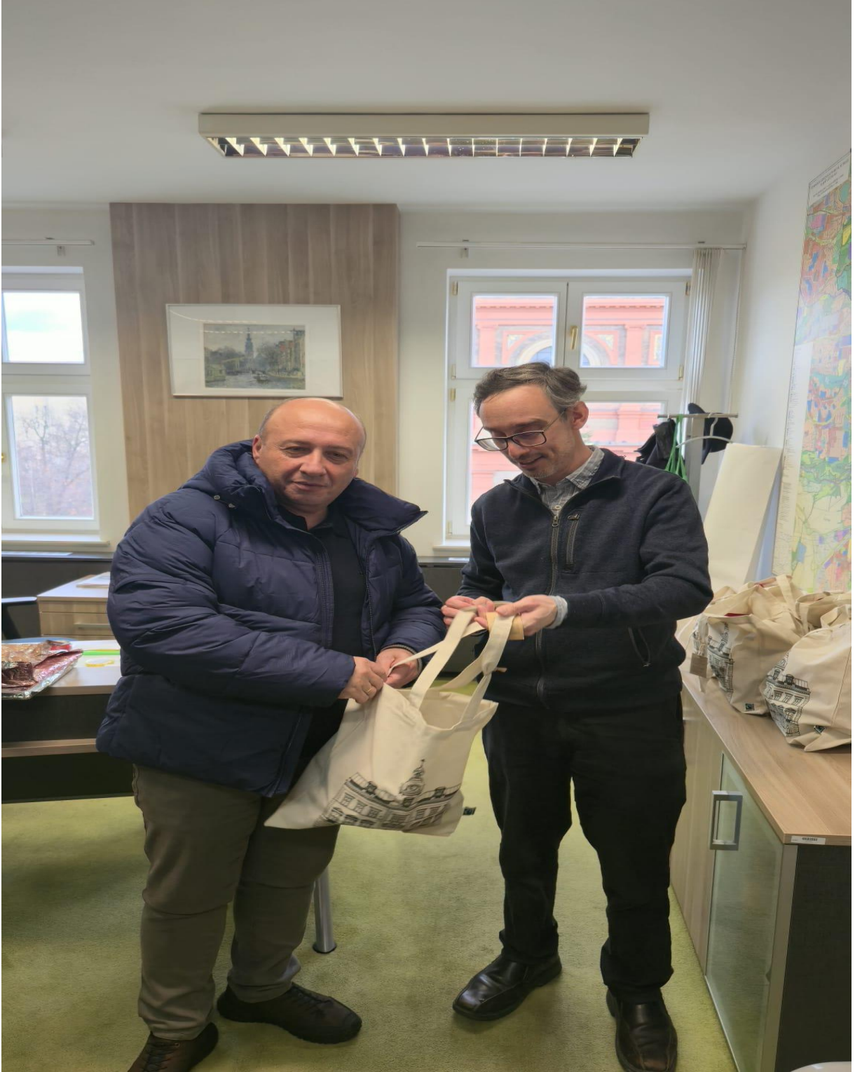
Mestska Cast Praha 5 Belediyesi Başkan Yardımcısı (Prag/ÇEKYA)