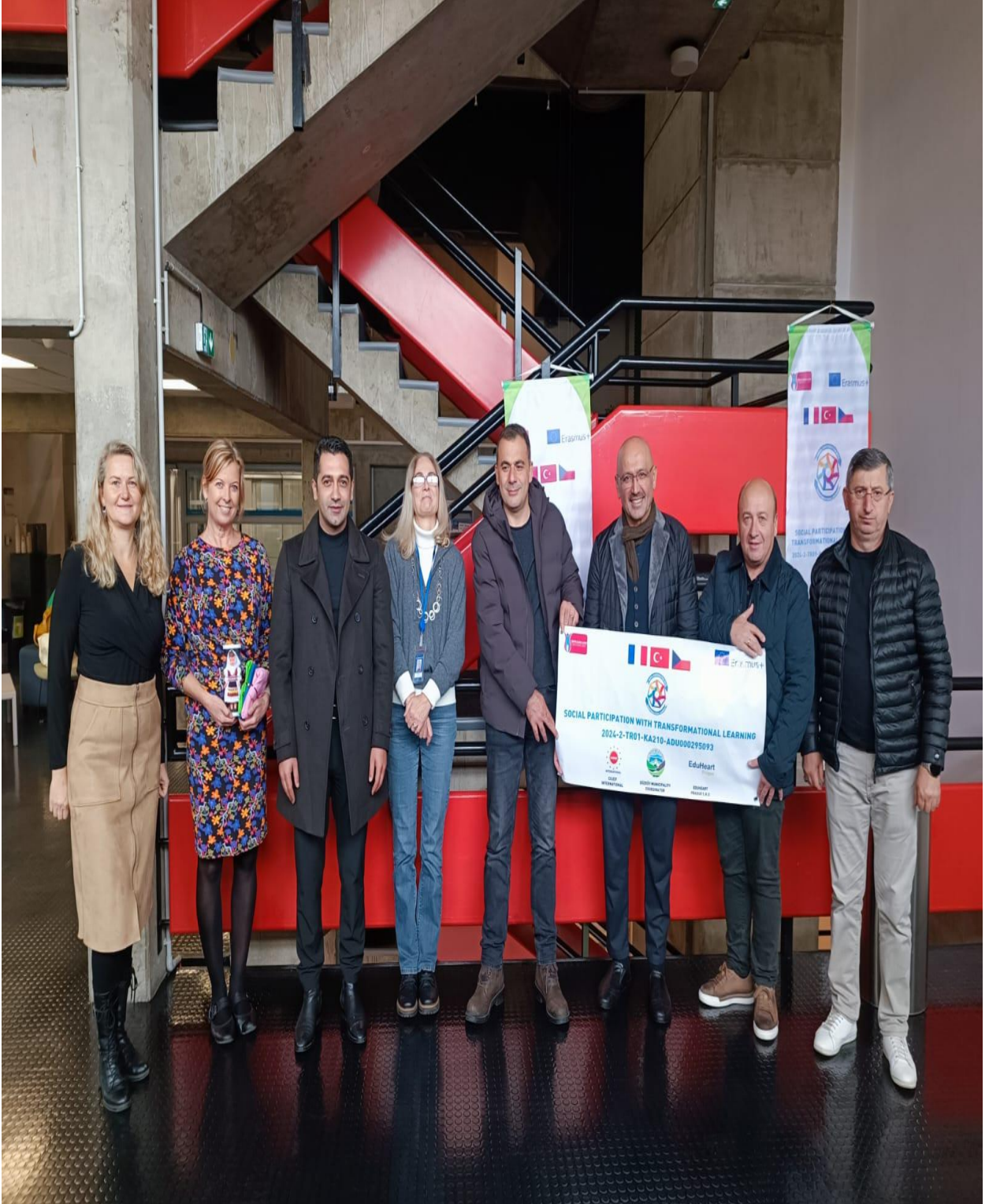
Avrupa Birliğine Toplantı Öncesi Ziyaret (Strasbourg/FRANSA)