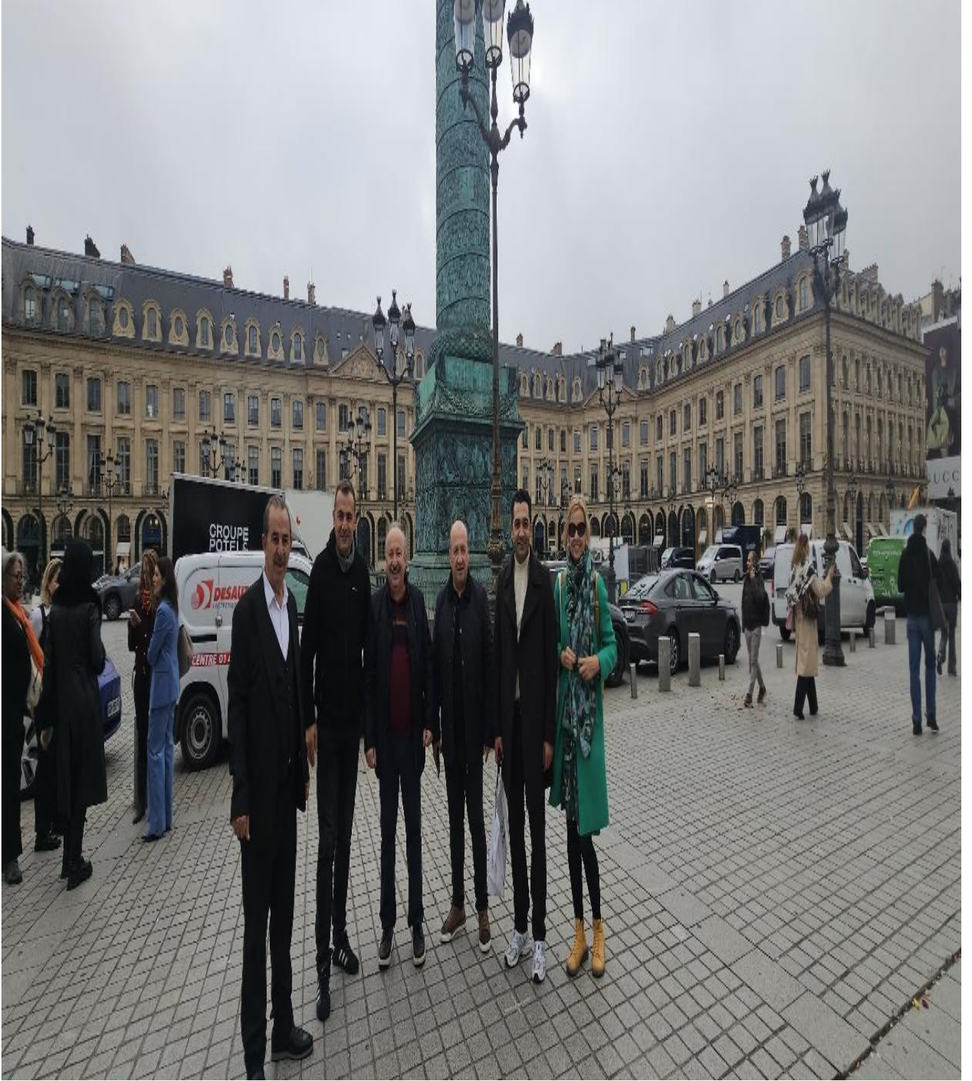
Şanzelize Meydanı (Paris/FRANSA)