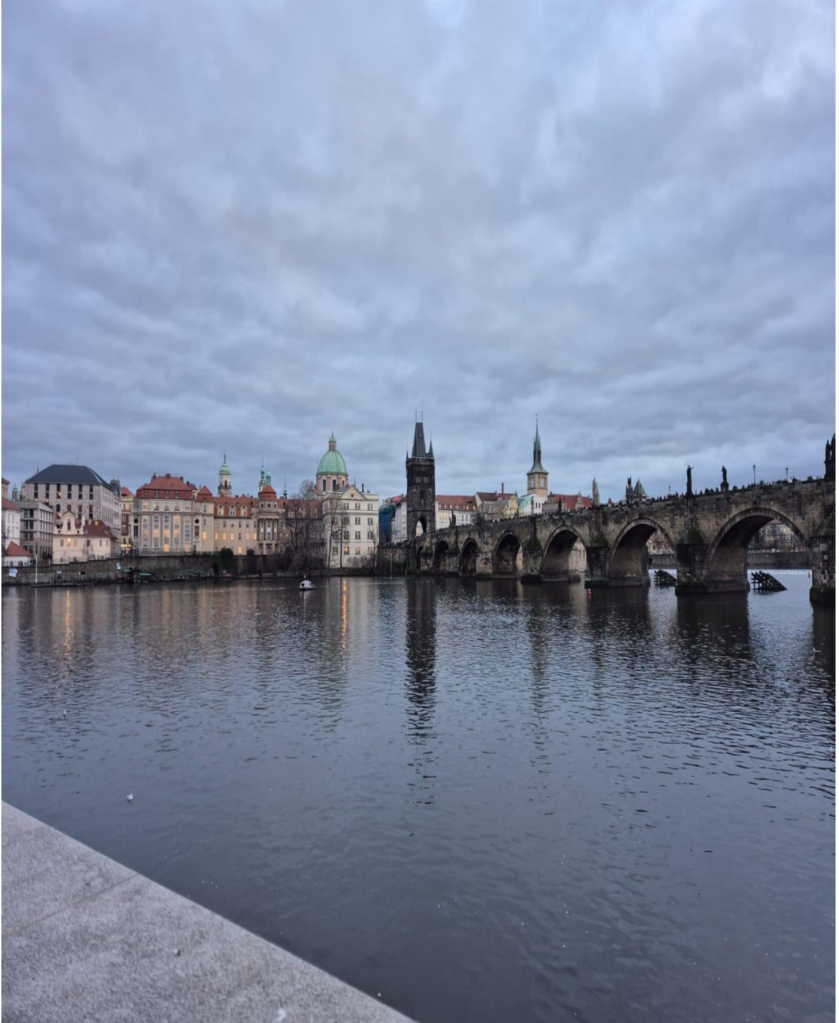
Prag'daki ünlü Karl Köprüsü (Charles Bridge / Karlův most) (Prag/ÇEKYA)