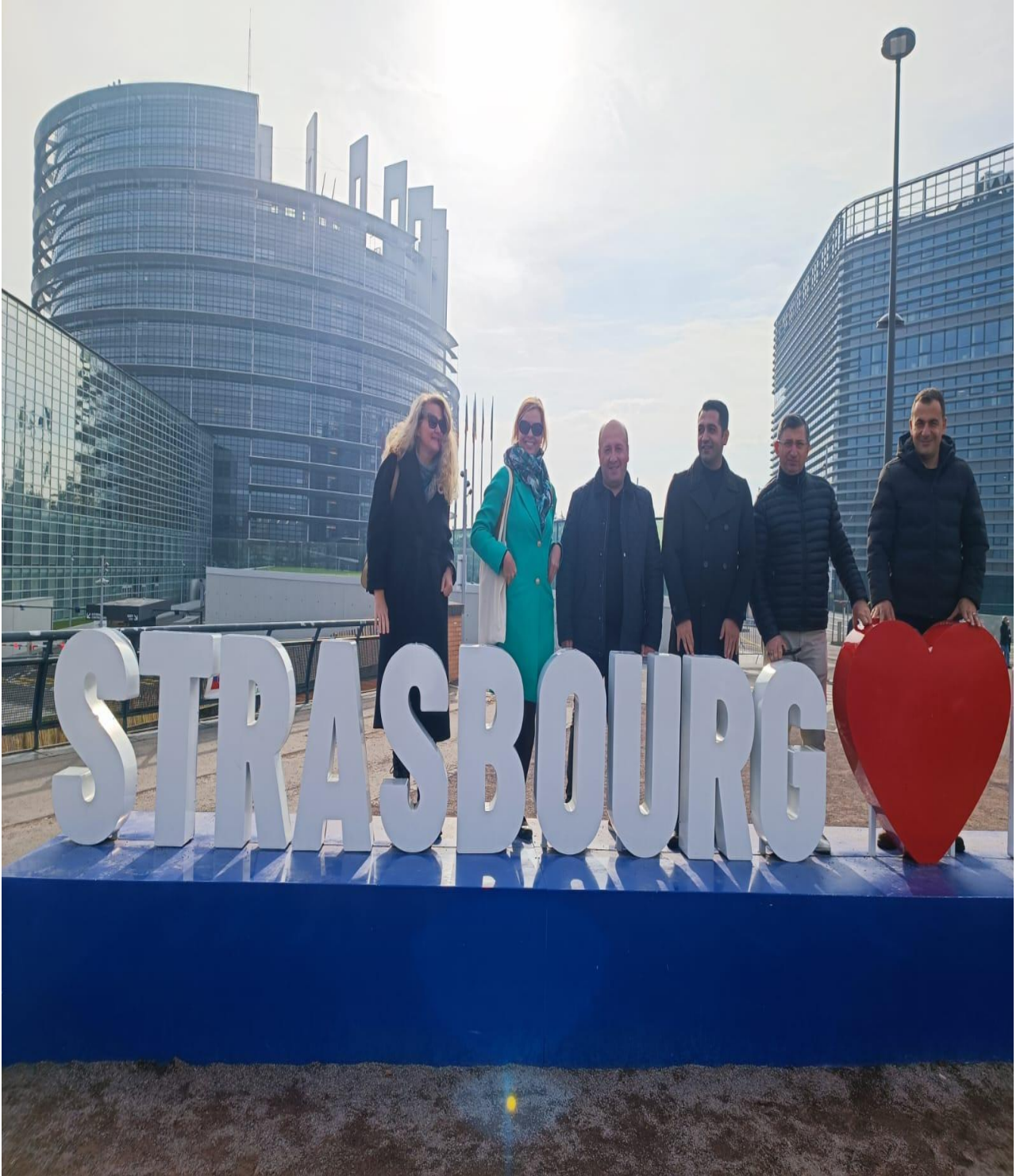
Avrupa Parlamentosu Binası Önü (Strasbourg/FRANSA)