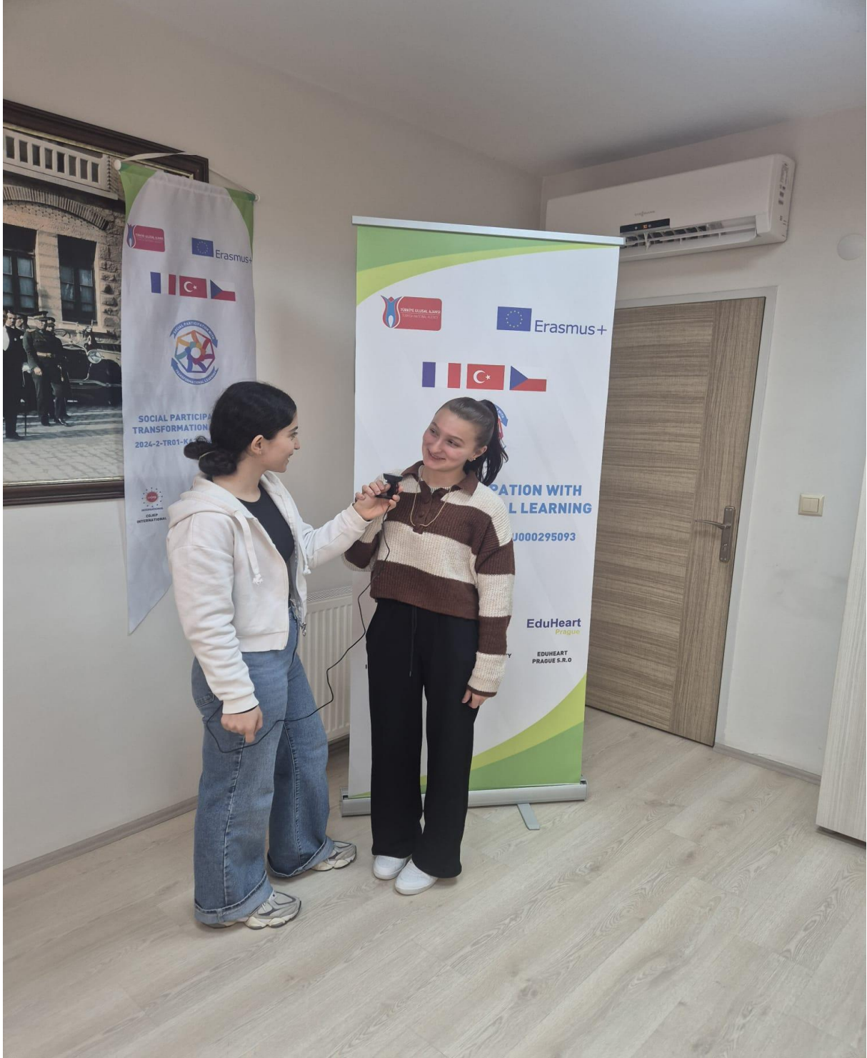
Katılımcılar ile Röportaj Görseli (Düzköy/Trabzon/TÜRKİYE)