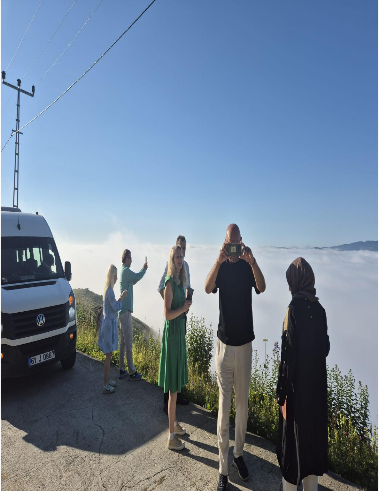
Hıdır Nebi Yaylası (Koryana /Akçaabat/Trabzon/TÜRKİYE)