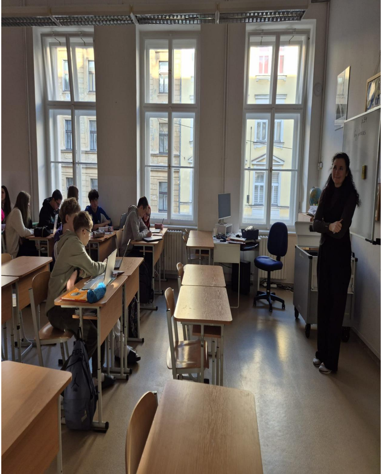
ZS Grafika Okulunun Ders Sırasında Ziyaret (Prag/ÇEKYA)