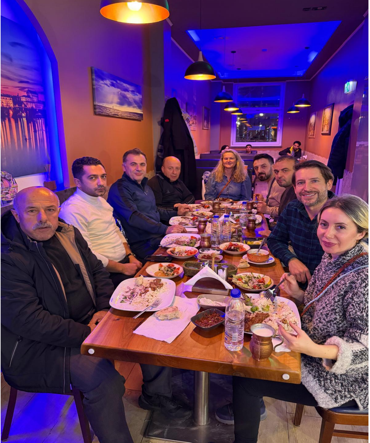
Dresten Meydanında Türk Lokantası (Dresden/ALMANYA)