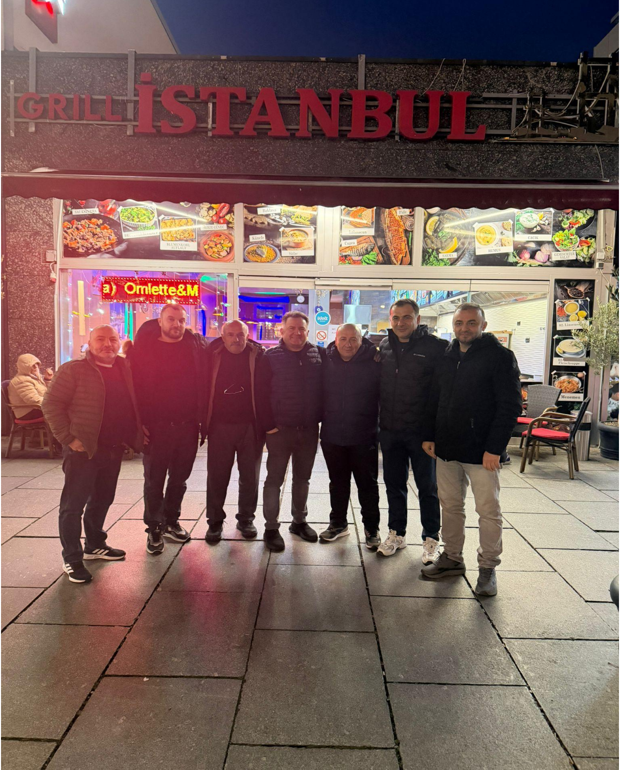
Dresten Meydanında Türk Lokantası Önü (Dresden/ALMANYA)