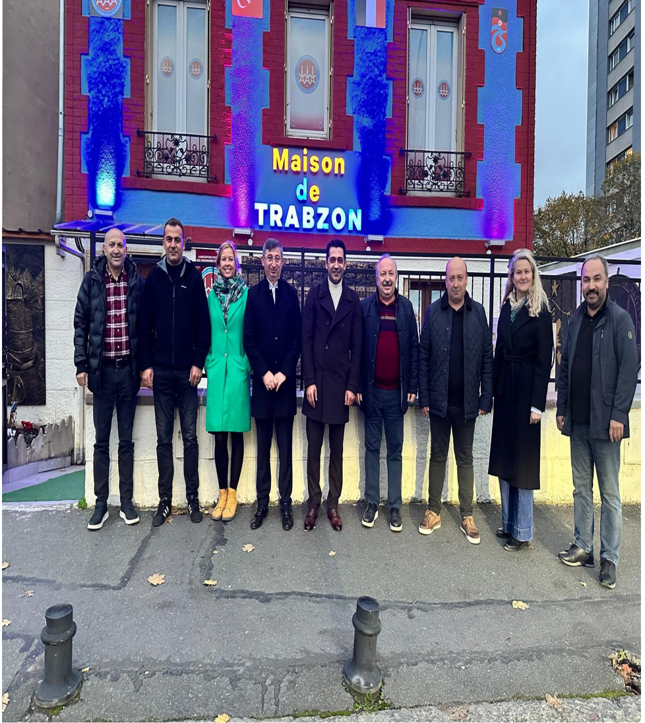
Paris Trabzonlular Derneğine Ziyaret (Paris/FRANSA)