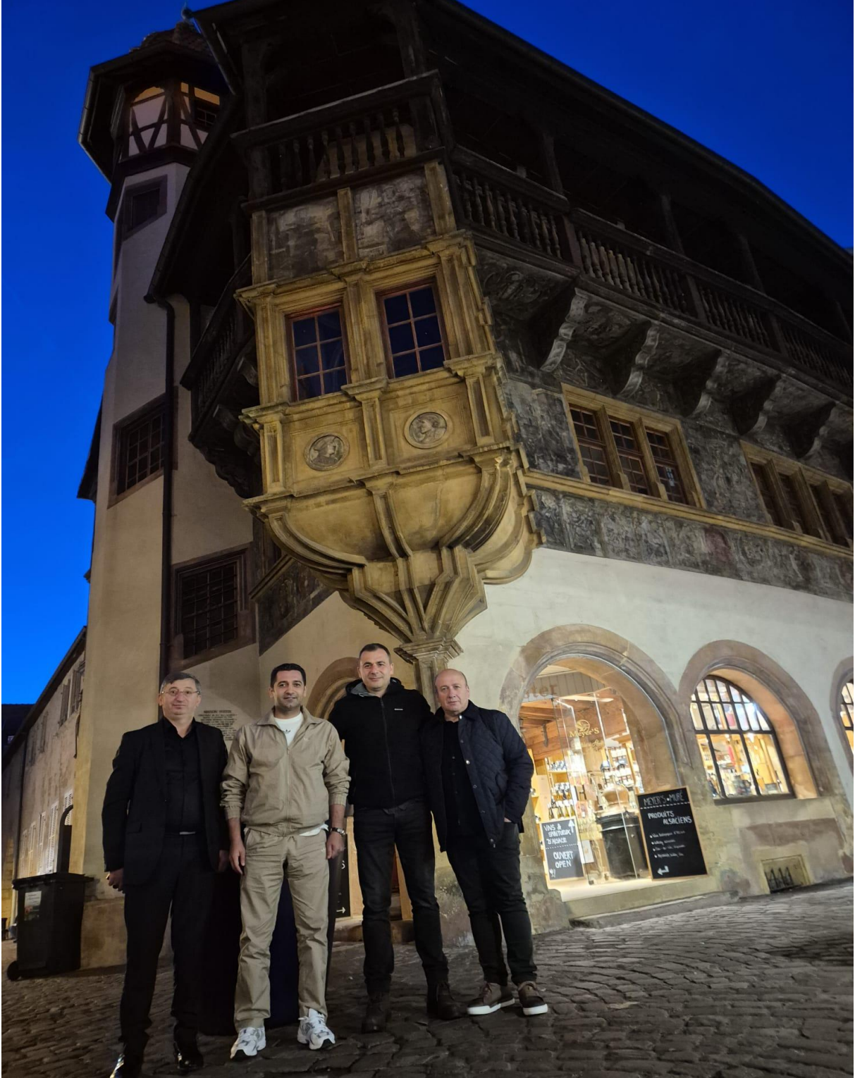
Colmar Bölgesi Tarihi Alışveriş Merkezi (Strasburg/FRANSA)