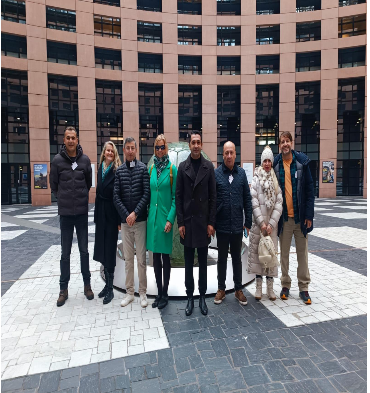
Avrupa Birliđi Binası İinde Toplu Grnt (Strasbourg/FRANSA)