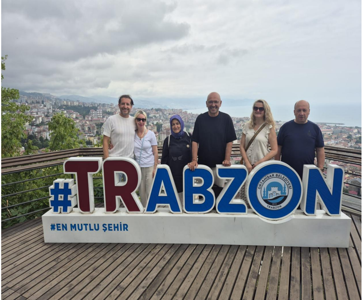
Atatürk Meydanı (Merkez/Trabzon/TÜRKİYE)

Türkiye (Düzköy Belediyesi), Çekya (Prag) ve Fransa (Strasbourg) kurumlarının iş birliğiyle gerçekleştirdiğimiz “Dönüşümsel Öğrenme ile Sosyal Katılım” projesi, Trabzon’un tarihî mirasını uluslararası düzeyde tanıtmayı, kültürel etkileşimi artırmayı ve sosyal katılımı güçlendirmeyi amaçlamaktadır. Trabzon merkezinde düzenlenen gezinti kapsamında Ayasofya Camii, Sümela Manastırı, Trabzon Kalesi, Atatürk Köşkü ve kültür-sanat merkezleri ziyaret edilerek şehrin tarihi mirası tanıtılmış ve katılımcılar gözlem ve deneyim odaklı bir öğrenme süreci yaşamış, yerel halkla kurulan iletişim sosyal katılımın güçlenmesine katkı sağlamıştır.