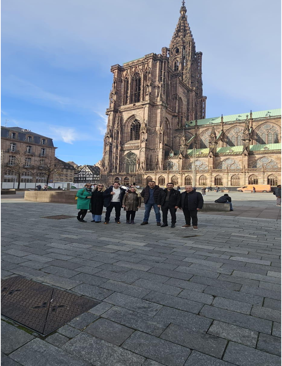
Notre Dame Katedral Güney Cephesi (Paris /FRANSA)