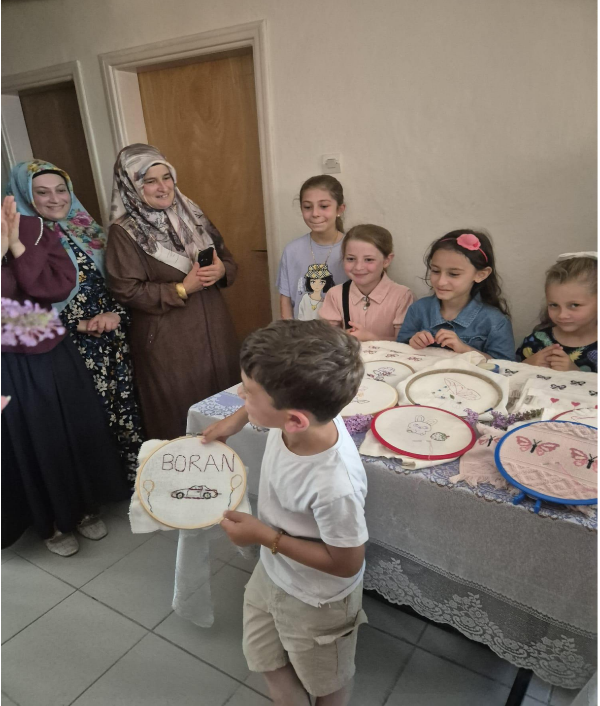
Düzköy Halk Eğitim Merkezi Yöresel Ürünleri(Düzköy/Trabzon/TÜRKİYE)