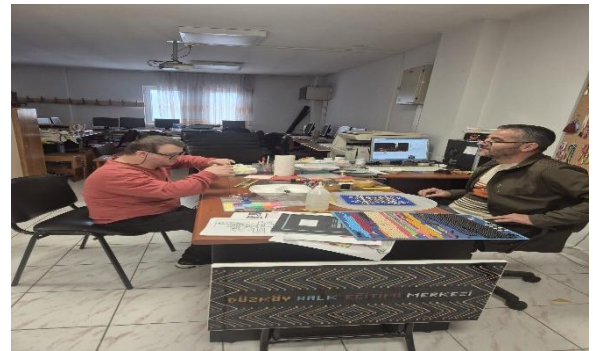
Düzköy Halk Eğitim Merkezi Dezavantajlı Grupların Eğitim Görselleri