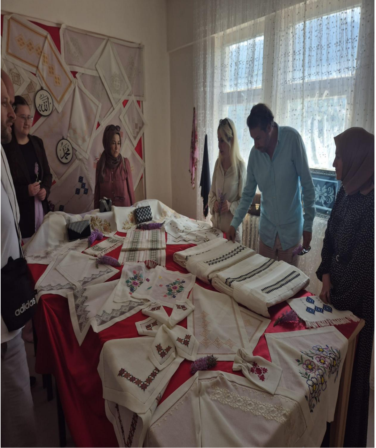
Düzköy Halk Eğitim Merkezi Yöresel Ürünleri(Düzköy/Trabzon/TÜRKİYE)